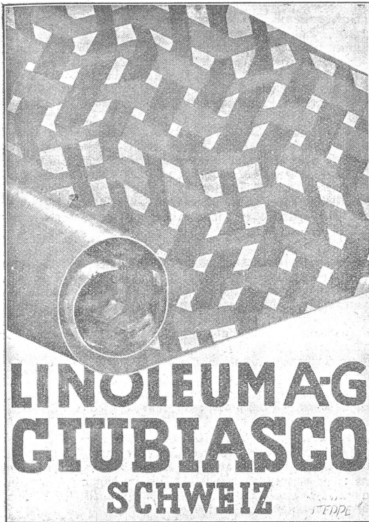
Ankauf (Fr. 100), Motto: „Steppe“. Verfasser: Hans Thöny, Graphiker, Zürich.