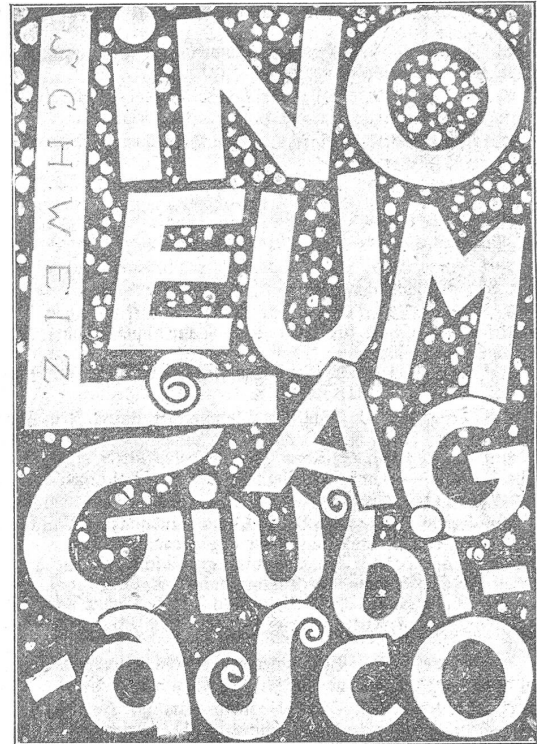
Ankauf (Fr. 100), Motto: „Futur II“. Verfasser: Charles Hug, Graphiker, Basel.