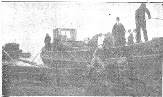
Abb. 4. Auflegen der Betongewichte vor der Absenkung. (21. Dezember 1924.)

Wie schon oben erwähnt, mußte die Leitung luftgefüllt versenkt und nach erfolgter Versenkung vom Saugkorb aus langsam mit Wasser gefüllt werden. Zu diesem Zweck ist am Bogen des Schlußstückes eine Drosselklappe eingebaut mit belastetem Hebel (Abb. 5). Das Betongewicht hatte die Abmessungen 50/50/50 cm und wurde in der Stellung bei geschlossener Klappe mittels Drahtseil gesichert. Abbildungen 2 und 5 zeigen die Aufhängenvorrichtung des Korfes (4 Drahtseile) und des Hebelgewichtes am Gerüst. Um 4 Uhr nachmittags begann die Absenkung; in gut einer halben Stunde war dieser schwierigste Abschnitt der ganzen Arbeit ohne Unfall oder Mißgeschick beendet. Sobald der Korf unter dem Endstück zum Aufsitzen kam, wurde der Haken (Abb. 2) mit einem Seil rückwärts herausgezogen; das Seil am Hebel der Klappe gab nach, das Gewicht fiel auf den Seegrund und öffnete den Verschluß, so daß das Wasser einströmen konnte. Die Entlüftung erfolgte am höchsten Punkt durch einen Hahn seewärts des geschlossenen Schachtschiebers am Ufer. Durch die Füllung der Leitung vom See her senkten sich vermutlich die Holzböcke in den Seegrund; auch sonst wird sich die Leitung in den teilweise stark wasserhaltigen, feinen Lehm eingebettet haben. Die Folge hiervon war ein Abrücken des Schiebers vom Uferschacht. Das Ergänzungsstück wurde durch Hochziehen des Rohres angebracht. Es blieb noch die Schließung