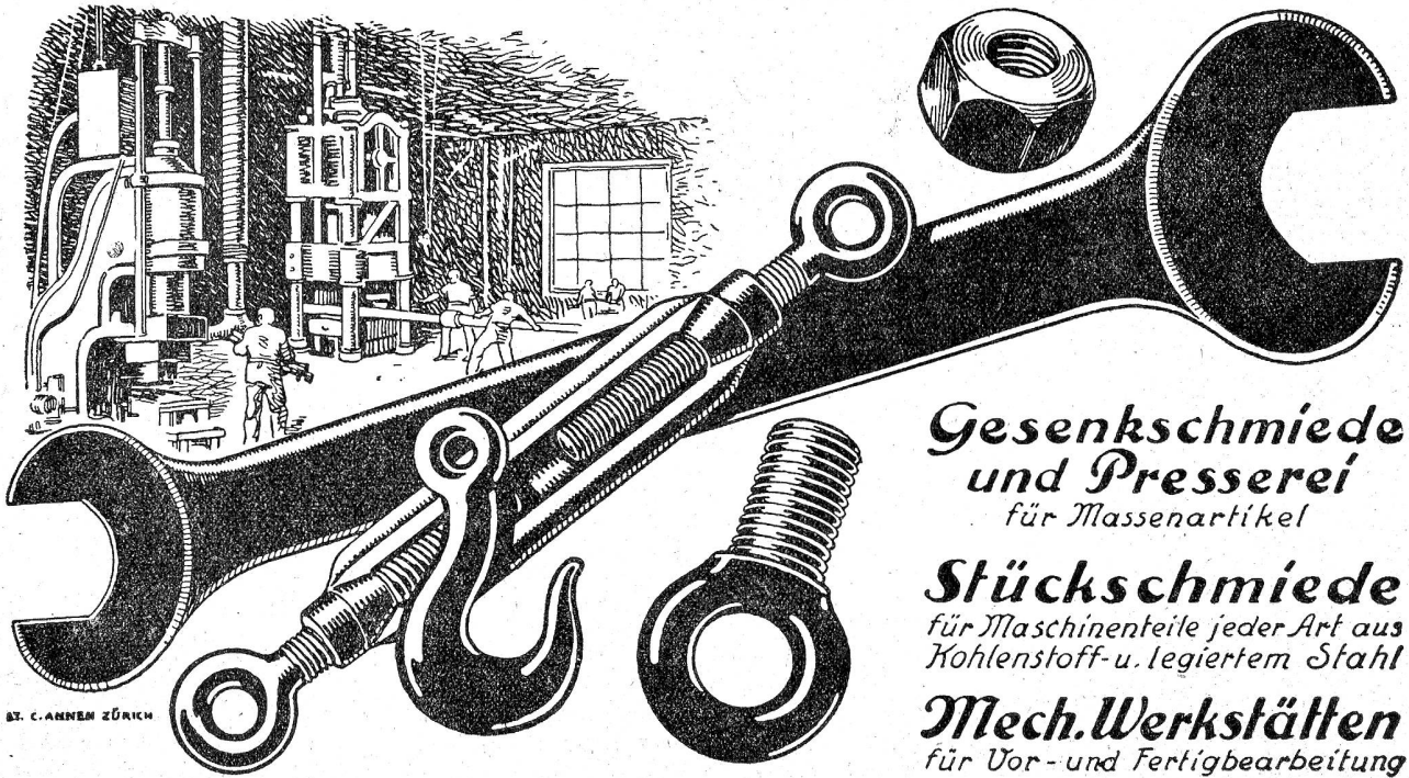
ST. C. ANNEH ZÜRICH

Gesenkschmiede und Presserei für Massenartikel