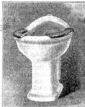
Abb. 3. Festmontierte Sitzbacken.

dieser Sitzgelegenheit selbst nicht stattfindet. — Der Vorteil verschwindet sofort, wenn die Klosetteinrichtung als Urinal oder Ausguß benutzt wird, und eine gründliche desinfizierende Reinigung nicht vorgenommen wird. Eine vollkommene Reinigung — wie bei dem aufklappbaren Sitz — kann natürlich niemals vorgenommen werden. Die Verbindung zwischen Sitzbacken und Steingutkörper kann nie so innig sein, daß nicht Fugen bestehen, die