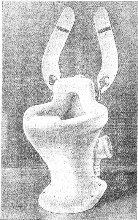
Abb. 4. Bewegliche Sitzbäden.

naturgemäß die geeignetste Aufnahme- und Abfuhrstelle für Unreinlichkeiten bilden. Nicht allein Schmutz, sondern die unsichtbaren Bakterien und Krankheitskeime setzen sich zwischen den Wulsten und dem eigentlichen Klosettörper fest, und können selbst bei gründlichster Reinigung nicht entfernt werden. Namentlich in Zeiten von Epidemien ist der aufmontierte Sitzbade als Krankheitsträger anzusprechen. Es ist nicht von der Hand zu weisen, daß sehr viele Ansteckungen auf diese unhygienische Einrichtung zurückzuführen sind. Die Gesundheitsbehörde in Berlin hat deswegen vorgesehen, die Anwendung von direkt aufmontierten Sitzbäden auf Klosettörpern generell zu verbieten und aufklappbare Sitze vorzuschreiben.