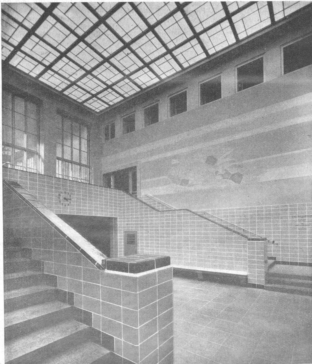
Stadtbad Schöneberg: Eintrittshalle.

Aus diesen Gründen ist die Niederdruckdampfkesselanlage unter normalen Verhältnissen bei mittleren und kleineren Badeanstalten vorzuziehen. Wo vorerwähnte Übelstände aber nicht in Betracht kommen und die Badeanstalt auch einen außerhalb liegenden Betrieb mit Wärme versorgen soll, so ist zu prüfen, ob es zweckmäßiger ist, Hochdruckkessel anzulegen.