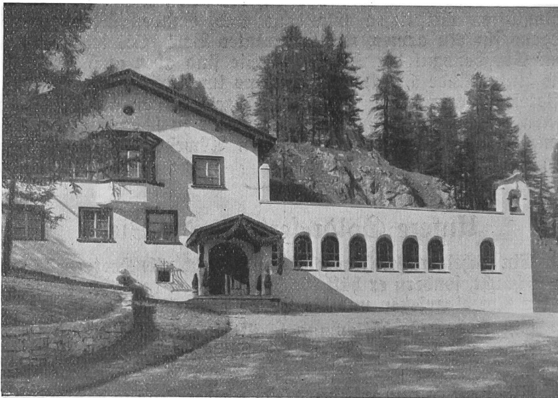
Christkönigs-Kirchlein und Pfarrhaus in Sils-Maria.

Und doch besitzt sie eine Reserve, die nicht einmal den Schwankungen des Geldmarktes und der Valuta ausgesetzt ist, eine echte Goldreserve — das ist die treue Liebe des katholischen Volkes.