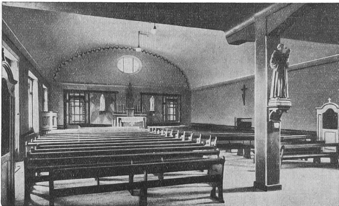
Dreifaltigkeitskapelle in Genf

Eine große Freude erlebten die verlassenen Katholiken im Haslital, als am 16. Juli der hochwürdigste Bischof von Basel unser Guthirt-Kirchlein zu Meiringen konsekrierte. Die massive Bauart fügt sich so harmonisch an die Felswand des Brünig und der schlichte Innenraum ist so fein abgetönt und zum Beten