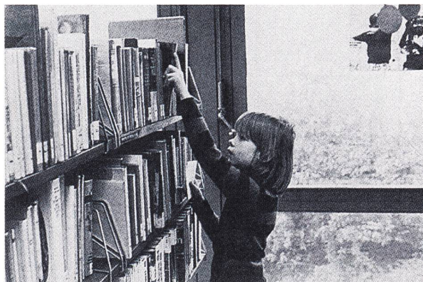
Vor- und Nachbereitung des Besuchs: In der Schulbibliothek ...

Die dabei entstehenden Begegnungen erfüllen einen mehrfachen Zweck: Sie geben Schülerinnen und Schülern Einblick ins professionelle Schreibhandwerk und sie regen mit Personen und konkreten Beispielen an