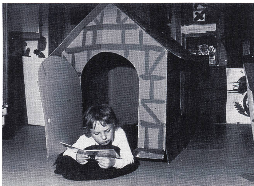
... oder im gemütlichen Lesehaus