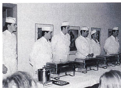
Die Küchenmannschaft des Pestalozzheim Neuhof

Erfahrungen herausarbeitete, die Pestalozzi hier gemacht hatte.