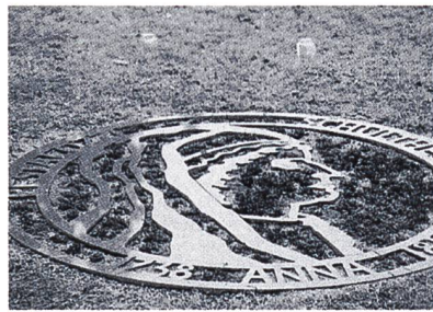
Bodenplatte für Anna Pestalozzi-Schulthess bei der Kirche von Birr