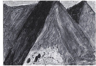
Gianpiero Bolliger, 11 Jahre: Die Berge meines Dorfes Giornico, TI 1969

Die Farbenpracht dieses Bildes: die weissen Vögel – sind es Tauben, sind es Pfauen? –, die uns auf roter Erde entgegen stolzieren, die Bäume grün und blau nebeneinander plaziert. Die Freiheit der Farben: Wenn ich dieses Bild anschau, sehe ich auch dich, vielleicht in einem roten Sari mit goldenem Muster, wie du grosszügig den Pinsel in die grüne Farbe tunkst und ein Bild der Freude malst.