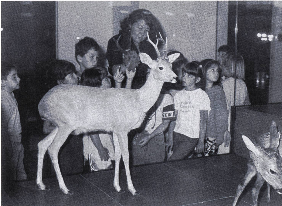
Workshop im Zoologischen Museum Zürich