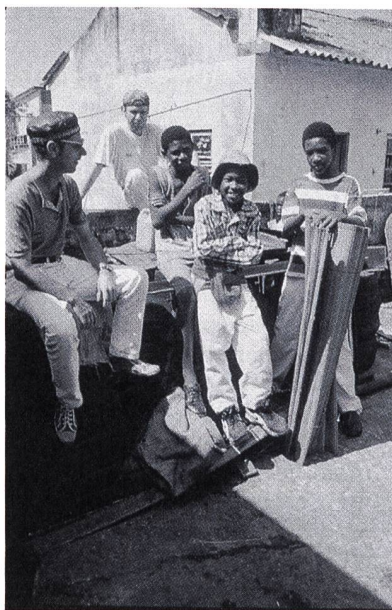
Die Jugendlichen rappen ihre eigenen Texte

ge, kaum Zugang zu sauberem Wasser, hohe Kindersterblichkeit (282 von 1000), kaum Bildung (50% Analphabeten), Millionen von Antipersonenminen auf Feldern und Wegen, ruinierte Landwirtschaft und Industrie.