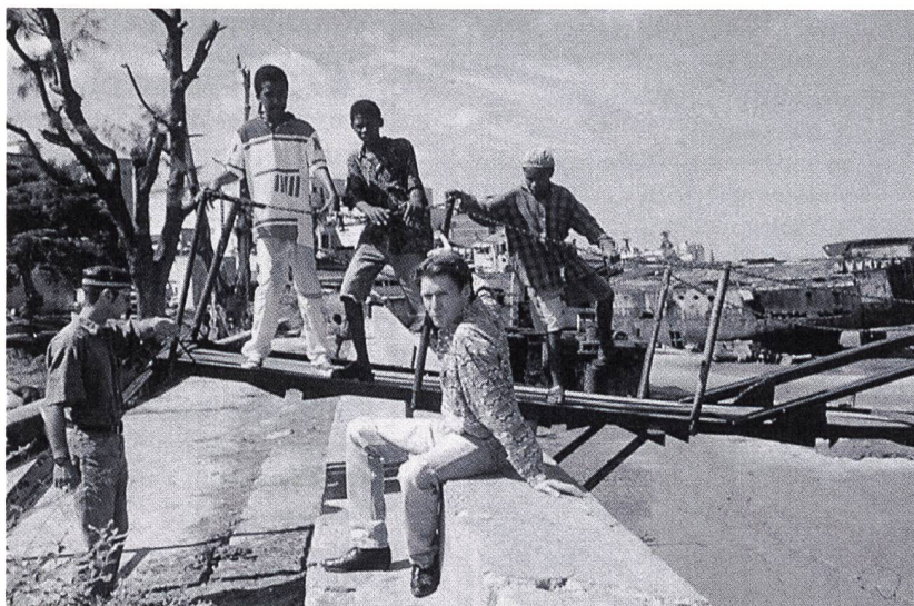
Fünf Musiker der 12-köpfigen Band Djovana

Ein Land im fernen Afrika: Mosambik, durch die Portugiesen kolonisiert und als Rohstofflager ausgebeutet, 1975 nach zehnjährigem Befreiungskrieg in die Unabhängigkeit entlassen, von 14 Jahren Bürgerkrieg (1978–1992) schwer gezeichnet: 1 Million Tote, 4 Millionen Flüchtlin-