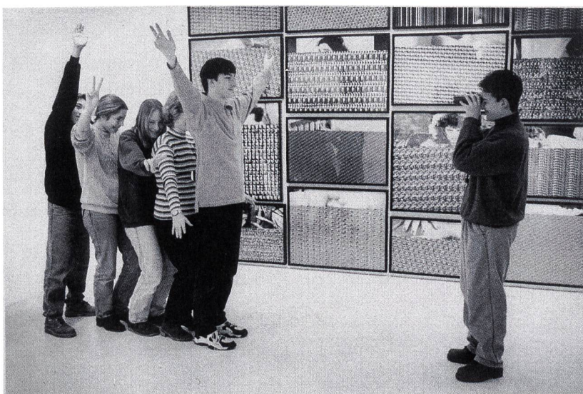
Workshop für Schulklassen im Fotomuseum Winterthur