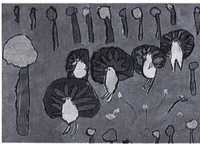
Madhuri T., 7 Jahre: Vögel 1956, Indien

Eine ganz andere Realität zeigt dieses Bild, eine glückliche Kinderwelt. Rollschuhlaufen im Park und den Wind um die Nase spüren. So schnell laufen wie die Wolken, die am Himmel vorbeiziehen. Ich muss lachen: Der Knabe fällt auf den Po, das Mädchen folgt mit runden Bewegungen gekonnt einer Linie. Patsy, und das 1953!