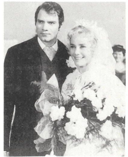
Maria Schell und Christian Marquand in Une vie (F 1958)