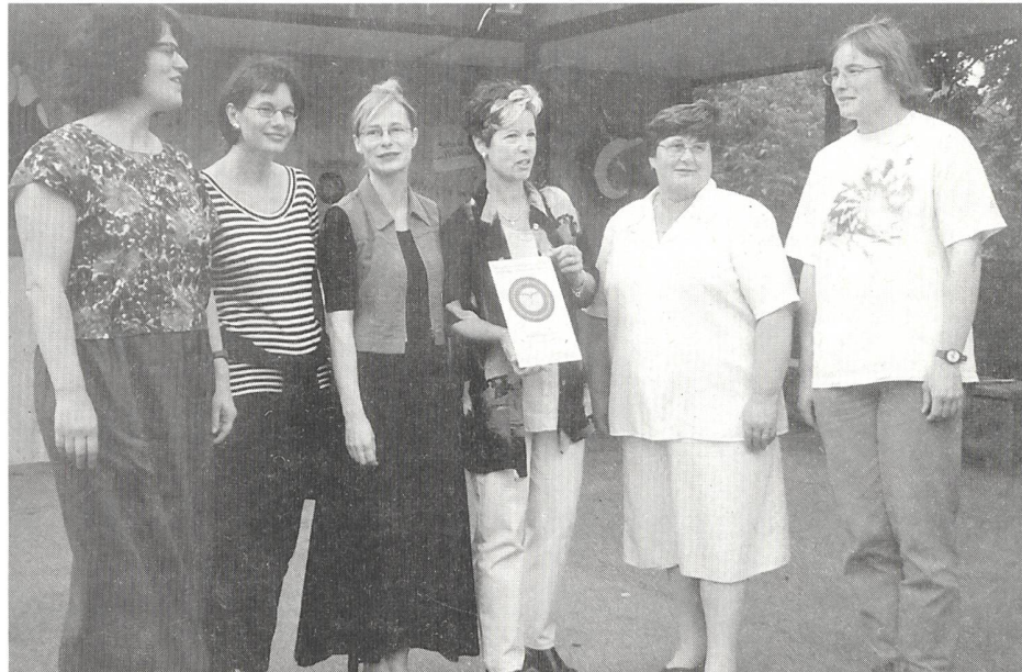
Erste Auszeichnung einer Schule im Kanton Zürich mit dem Label «Gesundheitsfördernde Schule»: Schulhaus Birchlen, Dübendorf.