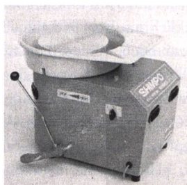
Töpferscheibe SHIMPO LP Die kompakte Töpferscheibe Fr. 1485.– inkl. Mwst