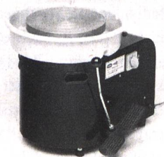
Töpferscheibe SSB 2 Töpferscheibe mit Ringkonus Fr. 1190.– inkl. Mwst