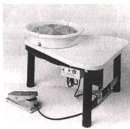
Töpfermaschine MICHEL E400 Die elegante Töpfermaschine Fr. 1790.– inkl. Mwst