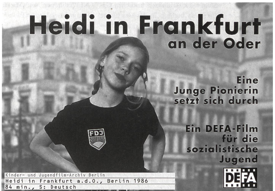
Fotomontagen: Daniel Lienhard, Zürich

Als Kind wurde mir Heidi vorgelesen, und ich habe den Film mit Heinrich Gretler gesehen. Ich war sehr berührt und habe mitgelitten. Als meine Kinder im entsprechenden Alter waren, haben auch sie verschiedene Versionen von Heidi gelesen, gehört und gesehen. Wieder habe ich mich mit der Geschichte auseinandergesetzt und mich gefragt