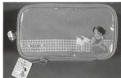
Souvenir aus Japan

paner/innen bevorzugen eher Artikel aus Plastik und kaufen oft kleineren Krimskrams als Mitbringsel für die Daheimgebliebenen, während die Schweizer Kundschaft eher nützliche Gegenstände erwirbt.