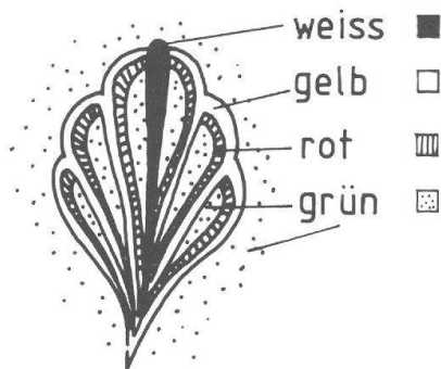
Abb. 1 Das Fragment des Lotuspalmetten-Plättchens aus Augst, Insula 31 (M. 1:1) und die schematische Verdeutlichung der Farbgebung.