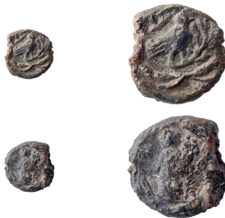
Abb. 5: Vorder- und Rückseite der Bleiplombe 4 (Inv. 1974.6815). Links: M. 1:1, rechts: M. 2:1.