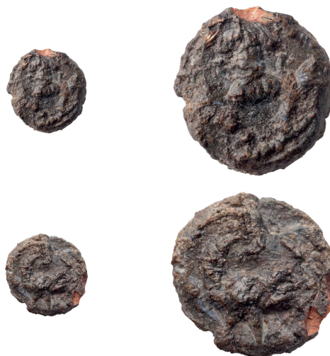
Abb. 6: Vorder- und Rückseite der Bleiplombe 5 (Inv. 1974.10235). Links: M. 1:1, rechts: M. 2:1.