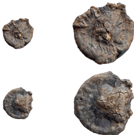
Abb. 3: Vorder- und Rückseite der Bleiplombe 2 (Inv. 1998.060.D09123.2). Links: M. 1:1, rechts: M. 2:1.

Literatur und Vergleichsbeispiele: (Vs.) Turcan 1987, 93 Nr. 275 (?); 115 Nr. 442 (?); 158 Nr. 764; 173 Nr. 857; Leukel 1995, 117 Nr. 501 (?); 177–181 Nr. N104 (?); Still 1995, 420 Nr. 790 (?).