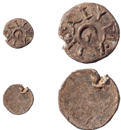
Abb. 2: Vorder- und Rückseite der Bleiplombe 1 (Inv. 1997.060.D08300.4). Links: M. 1:1, rechts: M. 2:1.

Anmerkungen: Die lateinische Inschrift gibt den Namen des A(ulus) Ti(-) Alypus im Genitiv wieder, der als römischer Bürger in seinem Besitz befindliche Waren mittels der vorliegenden Bleiplombe kennzeichnen liess. Das praenomen «Aulus» ist sowohl in literarischen als auch in dokumentarischen Quellen vielfach bezeugt. Vom nomen gentile sind mit «TI» lediglich zwei Buchstaben zu erkennen. Aus diesem Grund liegen mehrere Rekonstruktionsmöglichkeiten vor. Folgt man den von Barnabás Lőrincz im 4. Band des Onomasticon Provinciarum Europae Latinarum vorgelegten Resultaten, so mutet «Titius» als Restitutionsvorschlag sinnvoll an, da dieses nomen im Vergleich zu anderen mit «TI» beginnenden Familiennamen weitaus am häufigsten im gesamten Römischen Reich bezeugt ist 11 . Das deutlich zu erkennende cognomen «Alypus» weist auf eine Verbindung zum griechischen Osten hin. Inschriftlich ist es im Westen des Römischen Reichs häufiger im italischen Raum bezeugt, daneben aber auch in Hispanien, in der Gallia Narbonensis sowie in Dalmatien und in Pannonien 12 .