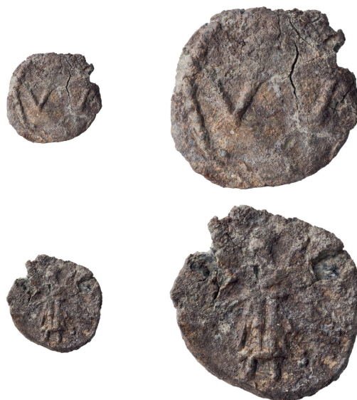
Abb. 4: Vorder- und Rückseite der Bleiplombe 3 (Inv. 1996.061.D05160.6). Links: M. 1:1, rechts: M. 2:1.

Literatur und Vergleichsbeispiele: (Vs.) Turcan 1987, 102 Nr. 352; 115 Nr. 439 (?); RIB II, 92 Nr. 2411.32; Leukel 1995, 106–108 Nr. 432; 433; 166 Nr. N48; Still 1995, 243 Nr. 9; 267 Nr. 121. (Rs.) Turcan 1987, 68 f. Nr. 129; 130; 115 Nr. 439 (?); 124 Nr. 502; 132–134 Nr. 562–580; Leukel 1995, 42 f. Nr. 75–77; 86 f. Nr. 315–321; 324; 325; 100 f. Nr. 409; 106–108 Nr. 432; 433; 162 Nr. N34; 197 Nr. N217–N221; Still 1995, 243 Nr. 9; 267 Nr. 121; 279 Nr. 181; Leukel 2002, 66 f. Nr. 124–127.