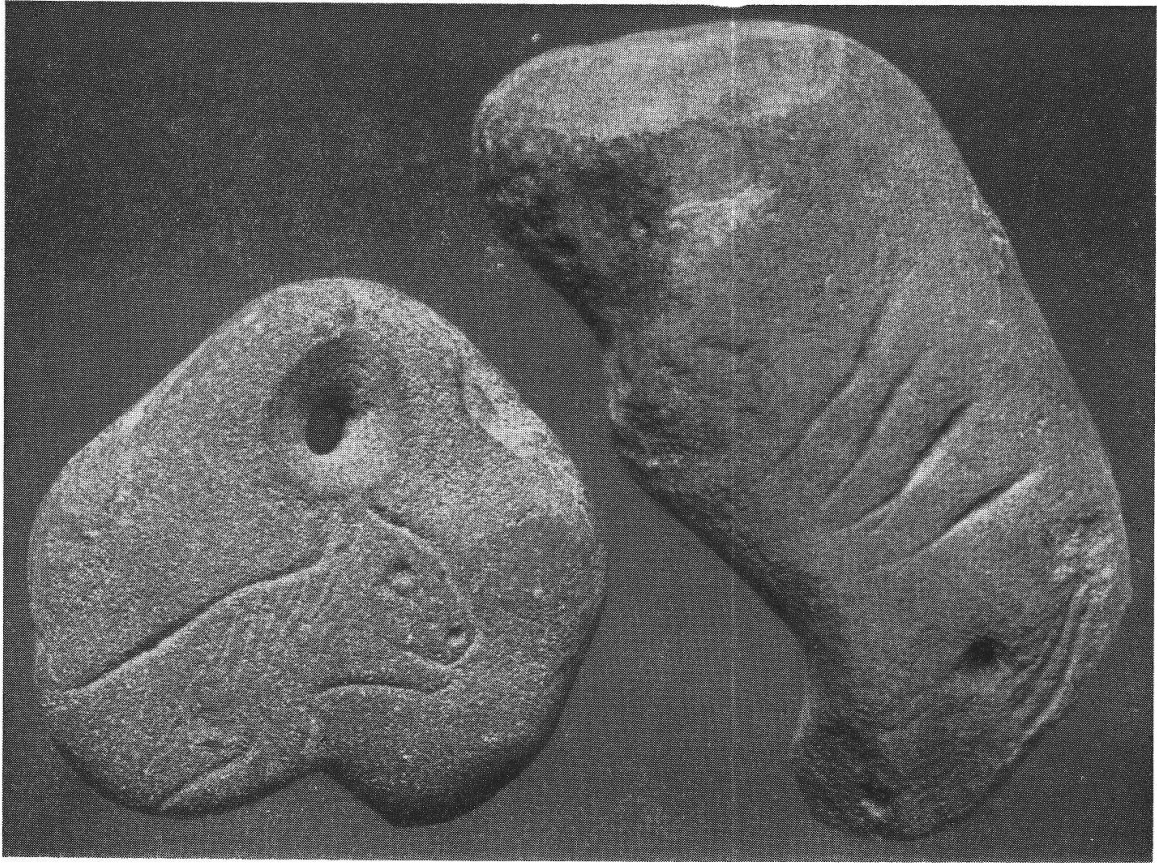
Tafel IV, 1. Baar. Baarburg. Felide und Auerochs. S. 73. (Aufnahme des Verfassers).