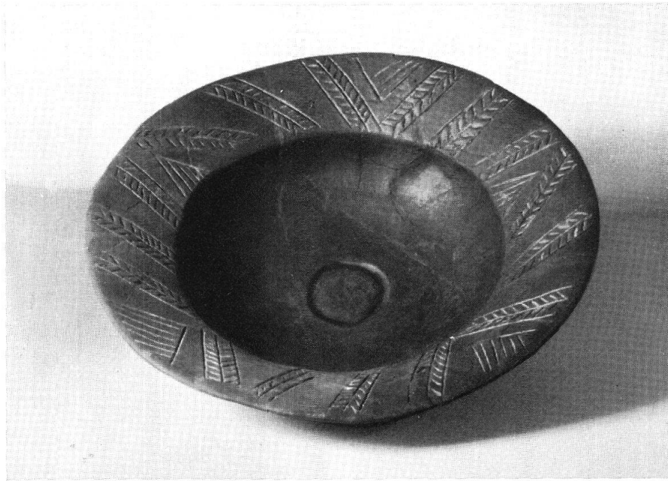
Taf. IX, Abb. 1. Sankert. Hemishofen (S. 56) Aus Jber. Mus.-Ver. Schaffhausen 1945