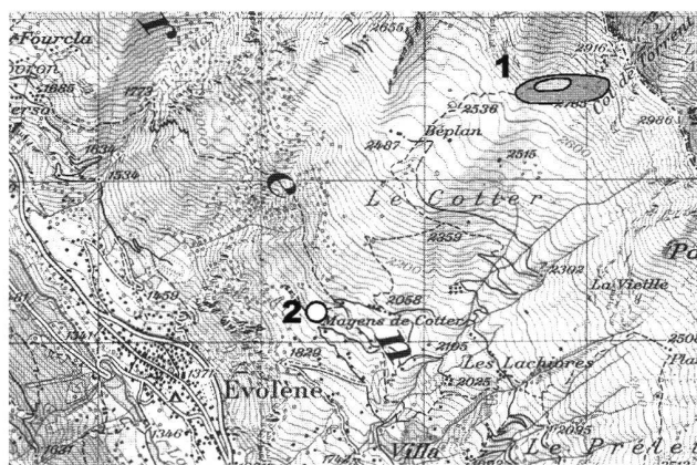
Abb. 2. Evolène VS. 1 Fundstelle der Bronzenadel am Weg zum Col de Torrent. Äussere Markierung: möglicher Fundbereich, innere Markierung: vermutlicher Fundbereich. 2 Schalen- und Zeichensteine auf Alp Cotter. Basis LK 283, 1:50 000.