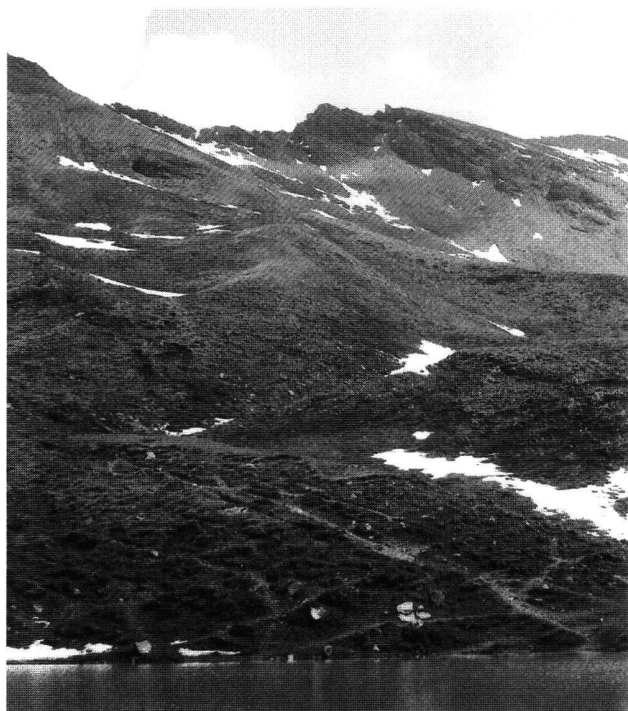
Abb. 1. Evolène VS. Blick vom kleinen See auf Alp Cotter zum Col de Torrent.

Die Bronzenadel ist 23,8 cm lang, der Durchmesser des Kopfes beträgt 1,5 cm (Abb. 3). Der trichter- oder trompetenförmige Kopf ist an seiner Oberseite ganz leicht gewölbt, an der Unterseite gerippt. In fünf Absätzen verjüngt er sich zum leicht konvex geschwungenen Hals. Darunter schliesst eine verdickte, mit Rippen verzierte Zone an. Man erkennt schmale und etwas breitere Rippen; die letzteren sind in sich durch vertikale Kerben noch weiter verziert. Die Anzahl der beiden Rippensorten (unverziert/schmal und verziert/breit) ist nicht ganz regelmässig. Zuerst finden sich zwei unverzierte Rippen, darauf folgt eine verzierte Rippe, dann wieder vier unverzierte, eine verzierte, vier unverzier-