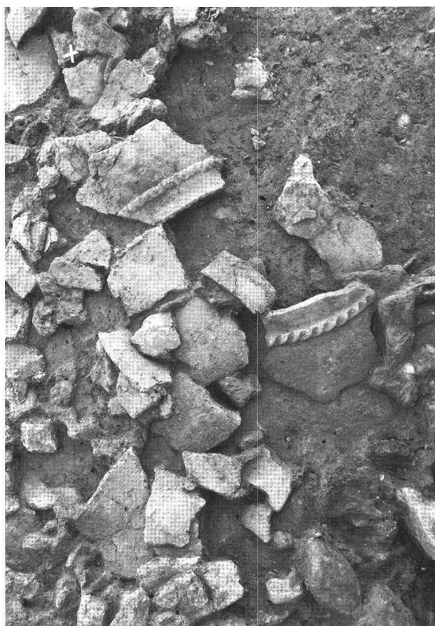
Fig. 3. Le Mormont (VD, Suisse). Détail des céramiques dans le niveau de démolition hallstattien.

L'anomalie 422 comportait deux ensembles distincts. Le niveau supérieur renfermait un corps en décubitus dorsal, associé à des restes de chevaux. Trente centimètres plus bas, trois nouveaux corps ont été déposés sur des restes d'animaux, deux adultes placés côte à côte en décubitus ventral et un enfant en décubitus dorsal (fig. 4). Les deux sujets adultes ne sont représentés que par le tronc et les membres du côté gauche. Les fémurs ont été cassés au milieu des diaphyses. Les avant-bras ont également été brisés aux extrémités distales. Il s'agit bien d'un dépôt de deux corps incomplets en connexion. Ces trois corps présentent des traces