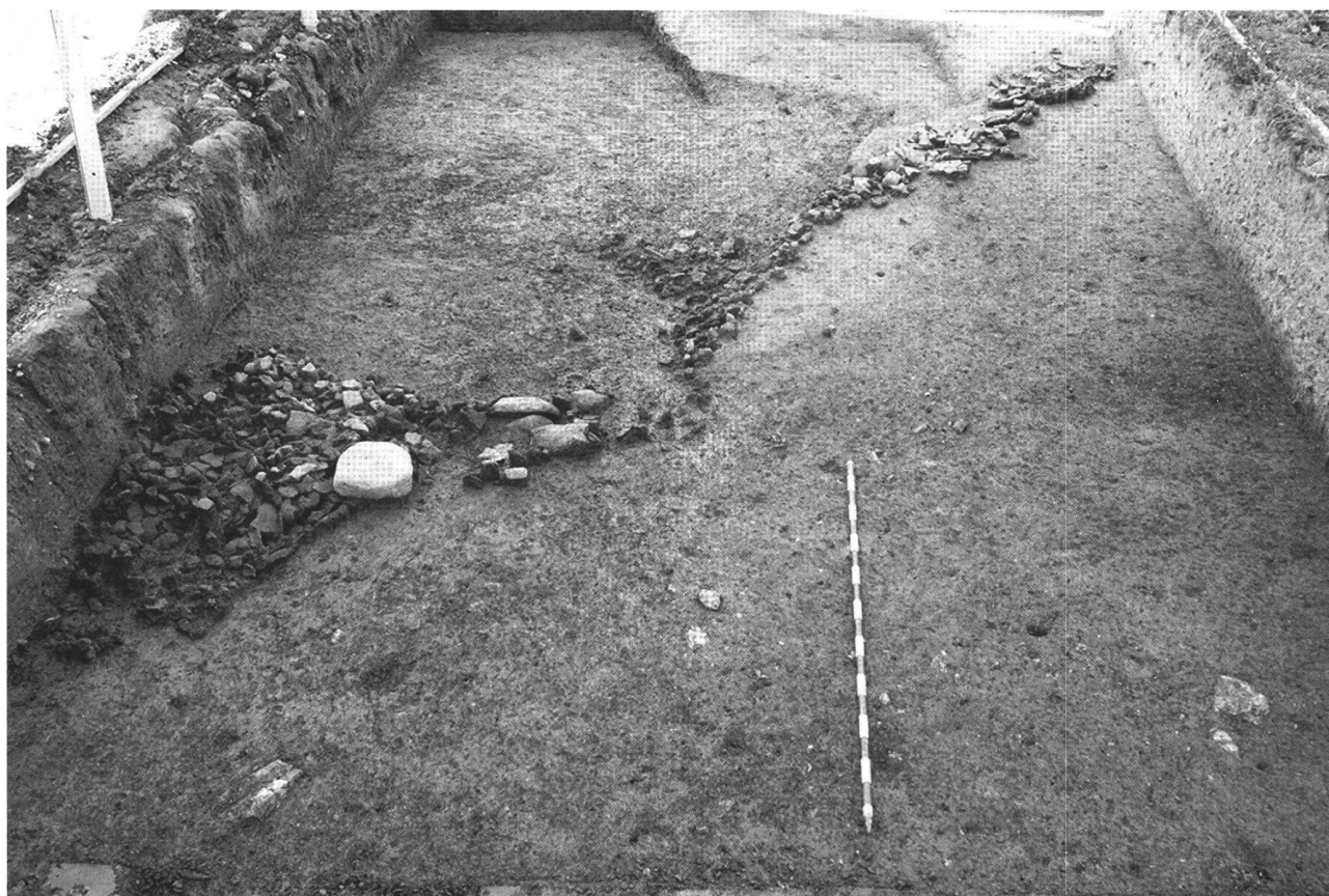
Fig. 2. Le Mormont (VD, Suisse). Les restes de la paroi effondrée. On remarque dans la partie gauche le pourtour circulaire d'une fosse laténienne qui a perturbé le niveau hallstattien.

alors que les deux avant-bras sont croisés sous une pierre en fond de sépulture. L'avant-bras gauche se distingue par l'absence de l'ulna alors que les autres os sont en connexion stricte. On retrouve donc dans ce dépôt les observations mentionnées lors de la fouille des inhumés assis du site d'Acy-Romance (Ardennes, France), à savoir des absences d'os qui s'opposent à l'observation de connexions labiles parfaitement conservées (Lambot/Méniel 2000).