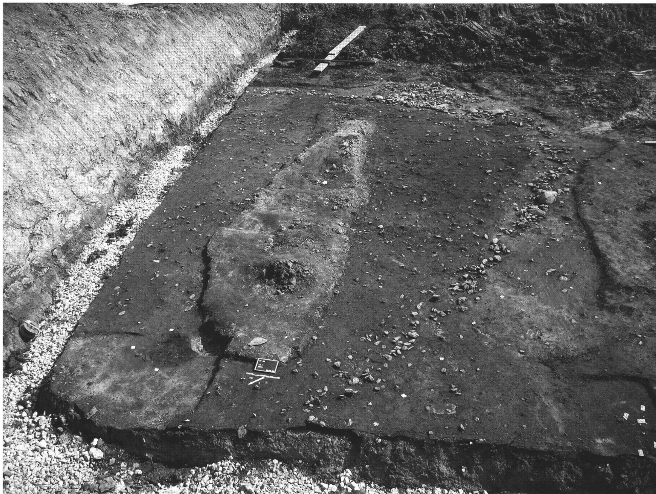
Fig. 2. Grimisuat VS, Champlan, Les Grands Champs. Vue générale du nord de la structure limitée par un alignement de pierres; en bas à gauche le foyer UT2, au centre la trace d'un sondage préliminaire.

Prélèvements: environ 14 pilotis en bois de chêne.