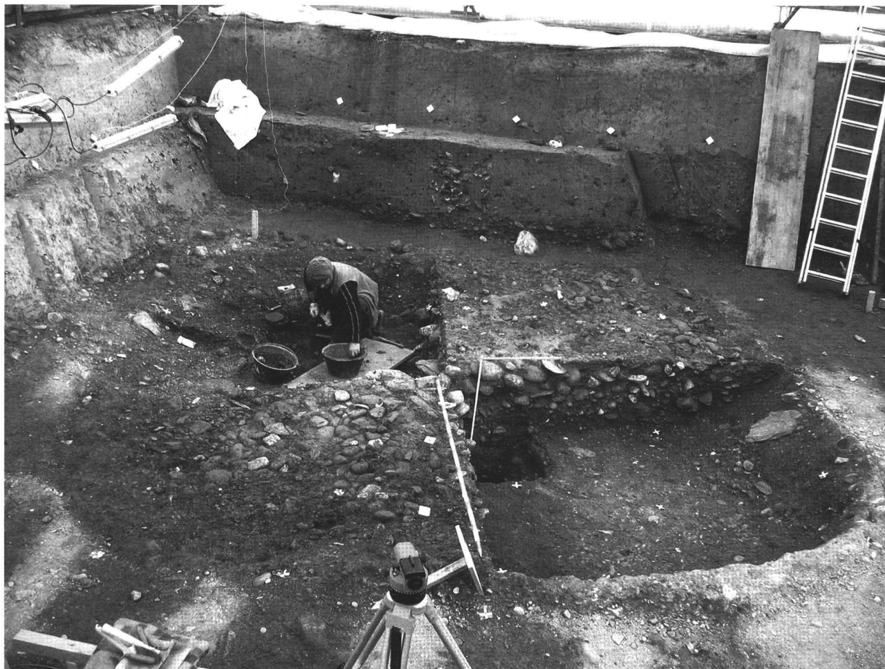
Fig. 3. Sion VS, Bramois, Pranoé, Immeuble Pranoé D. Vue du bâtiment semi-enterré 1 en cours de fouille.

203.248; Vallesia 56, 2001, 633.635s.; ASSPA 85, 2002, 358; Vallesia 57, 2002, 322s.; ASSPA 87, 2004, 396s.; 91, 2008, 207.