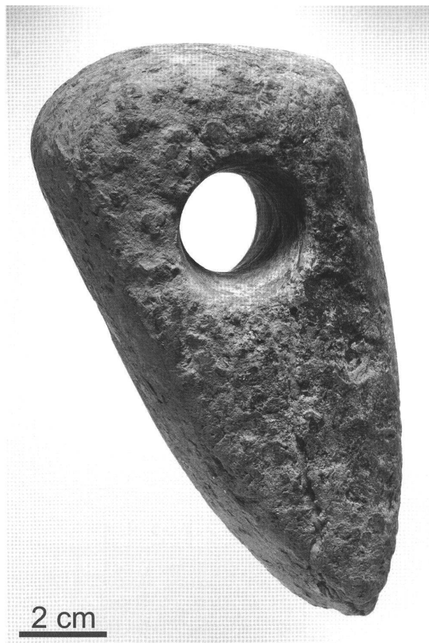
Fig. 5. Vellerat JU, Entre Douvelie. Hache perforée du Néolithique moyen ou récent. Longueur 14,2 cm.

KA ZG, R. Glauser, R. Huber und G. Schaeren.