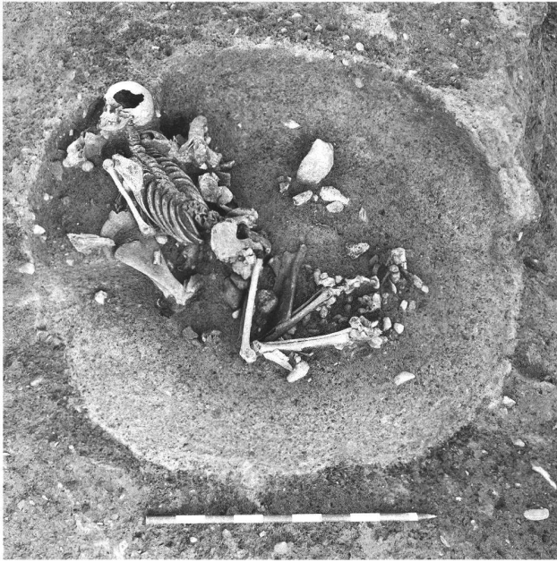
Fig. 8. La Sarraz VD. Sanctuaire du Mormont. Fosse 481. Dépôt du squelette d'une femme adulte accompagné de scapula, de chevilles osseuses et de fragments de crâne de bovins.