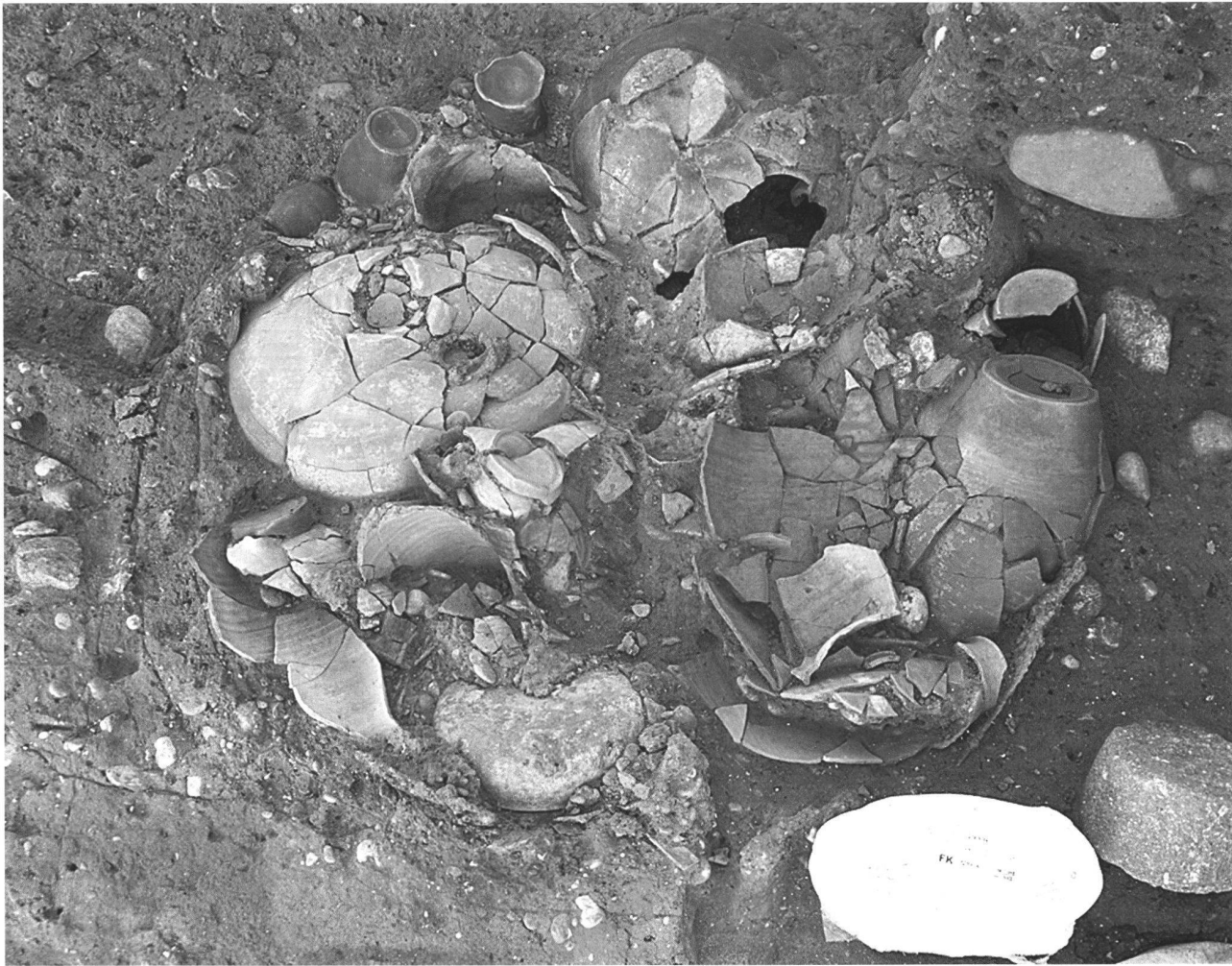
Abb. 7. Basel BS, Gasfabrik, Grabung 2009/36. Rheinhafen St.Johann. Blick auf die sekundär in einen Grubenkomplex eingebrachte Deponierung.

Dans la partie basse de la combe, nos vérifications se sont concentrées autour des sondages révélés positifs en 2009. Dans cette zone, il s'avère que le niveau archéologique ne se développe qu'en bordure nord de la parcelle soumise à la fouille. Ailleurs, le niveau archéologique, quand il est présent, est très érodé, et la couche de l'âge du Fer ne peut parfois pas être distinguée de celle de l'âge du Bronze. Il ne nous a pas été possible d'y identifier la moindre structure protohistorique.