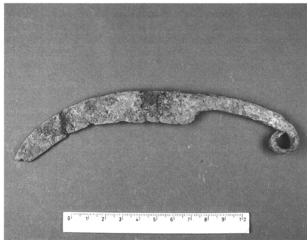
Abb. 11. Wartau SG-Gretschins, Ochsenberg. Eisernes Messer. Länge 16,7 cm.

Datierung: archäologisch. Spätbronzezeit; Hallstattzeit; La Tènezeit; Neuzeit. - C14. ETH-40070, 2465±30 BP, 760-520 v. Chr (1