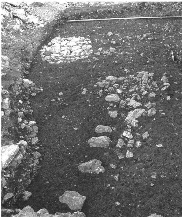
Abb. 10. Triesen FL. Hallstattzeitliches Gebäude mit Feuerstelle.

der Landesarchäologie in Zusammenhang mit einem privaten Neubauprojekt an der Fürst Johann Strasse in Triesen eine weitere archäologische Notgrabung durchgeführt.