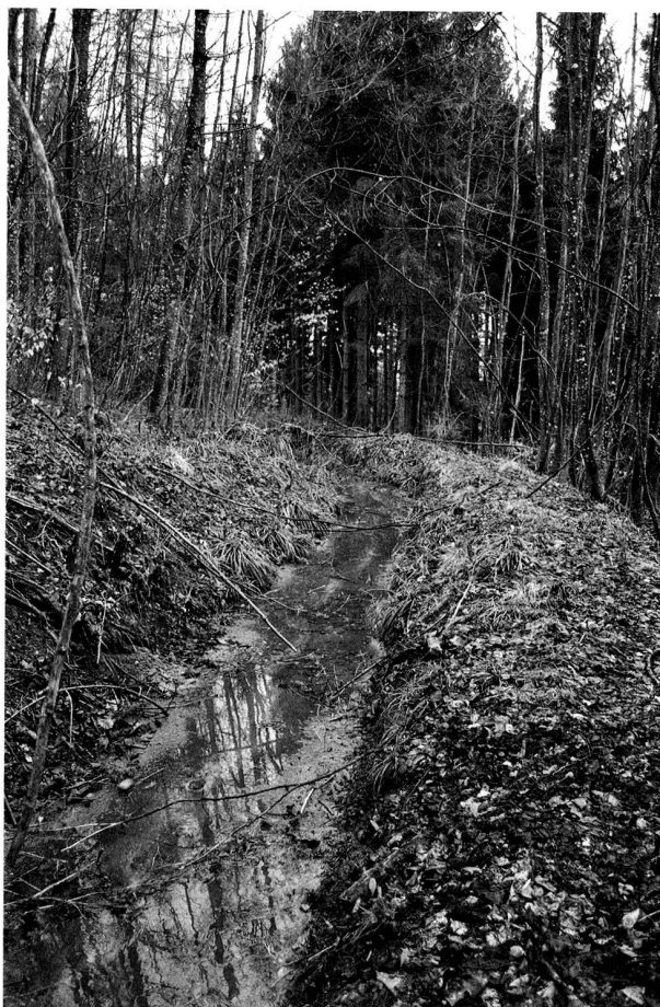
Abb. 48. Buchs ZH, Berg. In den Hang gebauter Kanal des Mötschenbachs.