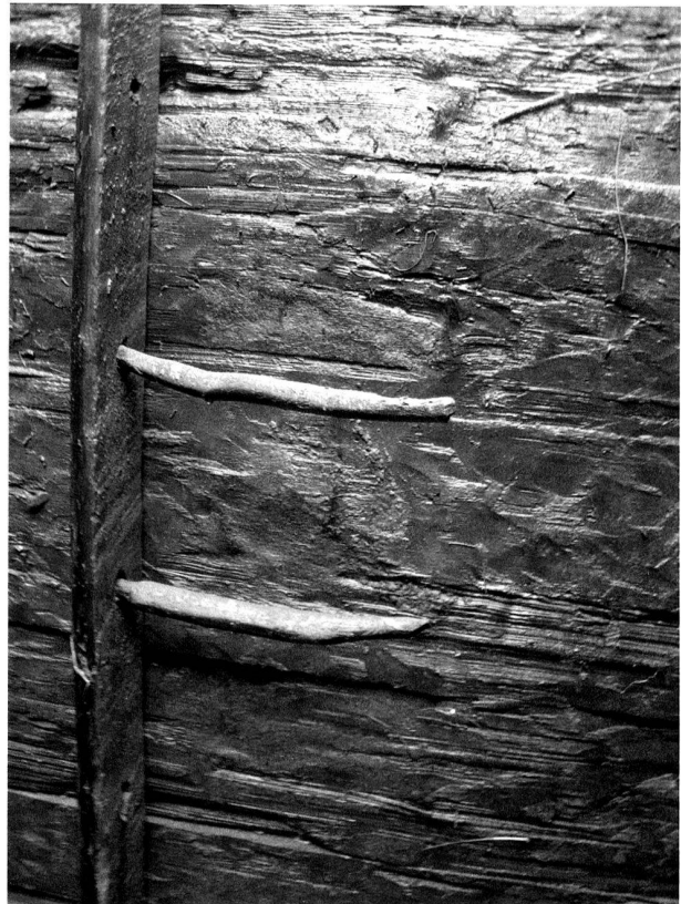
Fig. 50. Ste-Croix VD, L'Auberson. Détail de l'échelle encore en place. Photo AC VD, M. Liboutet.

Im Rahmen der archäologischen Begleitung wurden bekannte und neu entdeckte Stützmauern sowie das teilweise freigelegte Strassenniveau mit Pflasterungen und Kargelisen dokumentiert (Abb. 52). Dabei bestätigten sich die Erkenntnisse der Sondierungen von