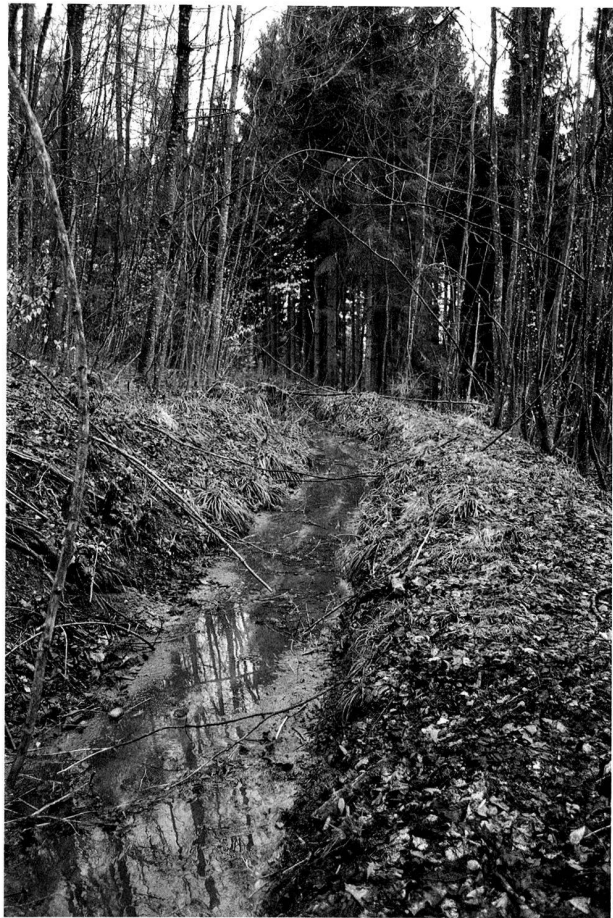
Abb. 48. Buchs ZH, Berg. In den Hang gebauter Kanal des Mötschenbachs.