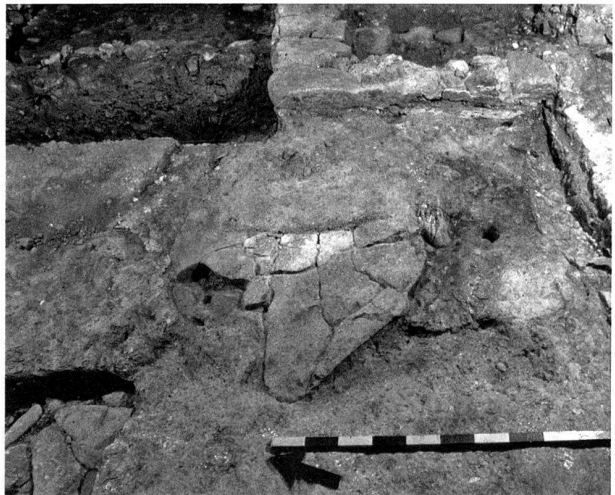
Abb. 51. Walchwil ZG, Dorfstrasse 17. Küche, Blick nach Osten. Es fanden sich die Reste der Herdstelle von 1580 (oben) und von Herdstellen zweier Vorgängerbauten (Bildmitte und unten links). Das weist auf eine für ländliche Profanbauten seltene Standortkontinuität seit dem Spätmittelalter hin.