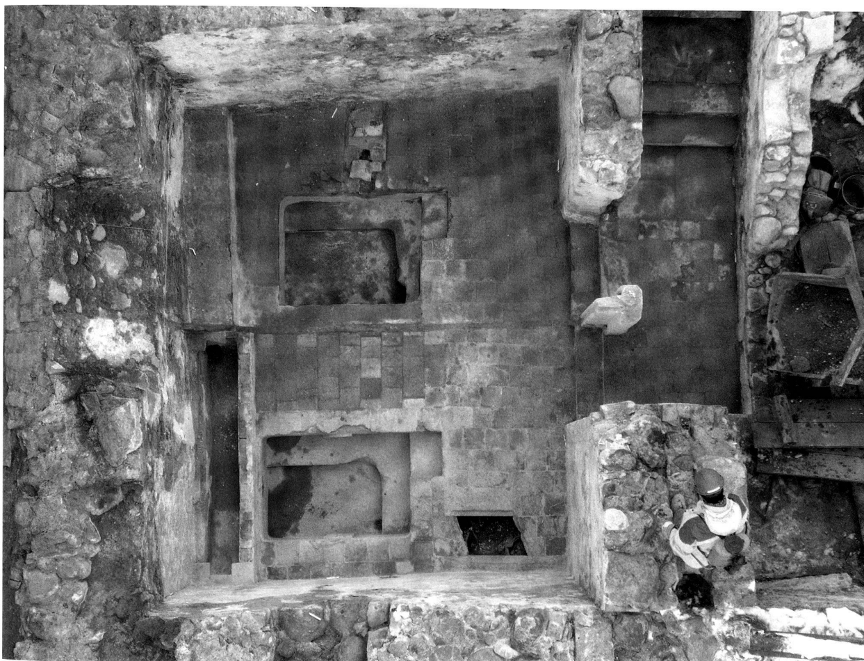
Abb. 47. Baden AG, Bäderquartier, «Fälklein». Letzter Zustand unmittelbar vor dem Abbruch um 1876. Korridor und Badekeller mit Bassins vom jüngsten Typ, am linken Bildrand gewöhnlicher Keller.