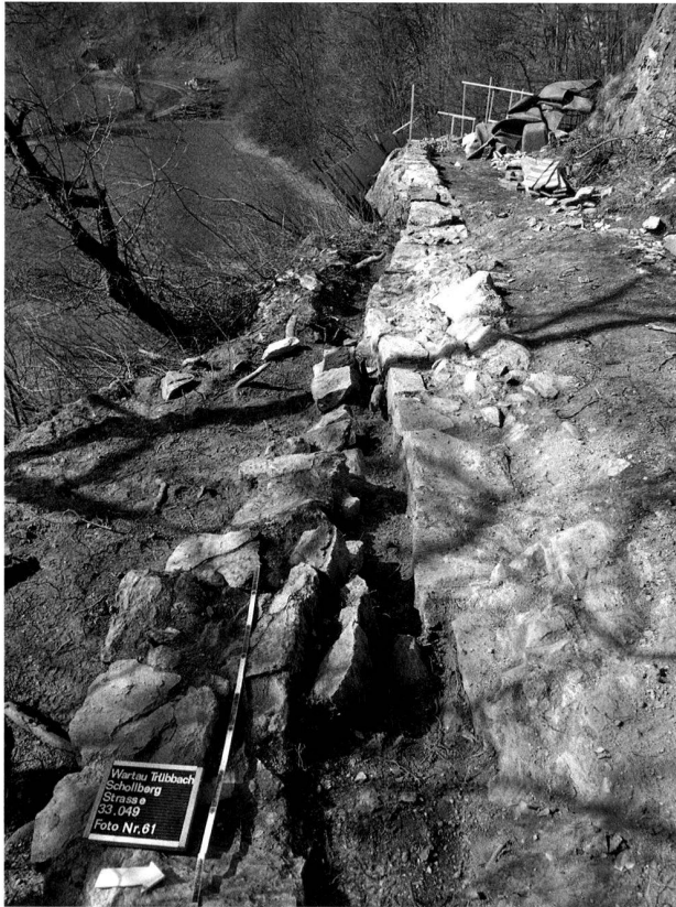
Abb. 52. Wartau SG, Alte Schollbergstrasse. Wegstrecke bei der exponierten Stelle an der Hohwand: Eine Stützmauer (rechts im Bild) sichert die Strasse an der steil abfallenden Felskante (ganz hinten im Bild). Sie wurde durch eine jüngere Stützmauer (links im Bild) bei einer Strassenverbreiterung ersetzt.

2010 im Wesentlichen: Mehrere zum Teil schlecht erhaltene Strassenpflasterungen lassen eine lange Benutzung der Strasse erkennen. Dabei wurde die Strasse hangseits mit Hilfe von Sprengungen, talseits durch den Bau von Stützmauern verbreitert. In den Stützmauern wiederverwendete Felsbrocken mit Karrgeleisen zeugen von Eingriffen in die Strassenpflasterung.