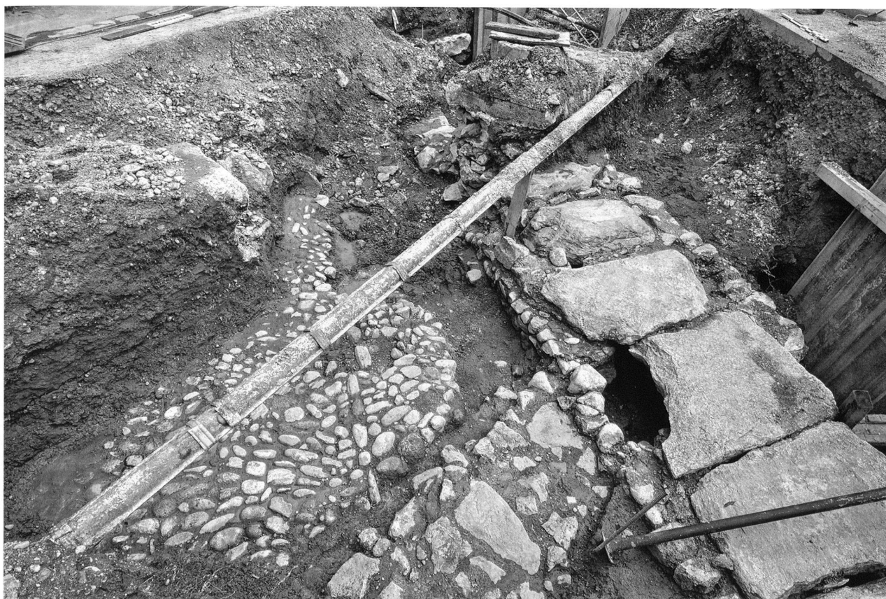
Fig. 58. Rolle VD, Rue du Port - Ruelle des Halles. Le niveau de pavage supérieur et les coulisses découverts à la rue du Port.