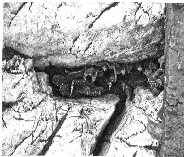
Fig. 14. La Sarraz/EclépensVD, Le Mormont. Fosse 722. Dépôt d'ossements animaux au fond de la fosse, dégagé sur sa moitié sud-est.