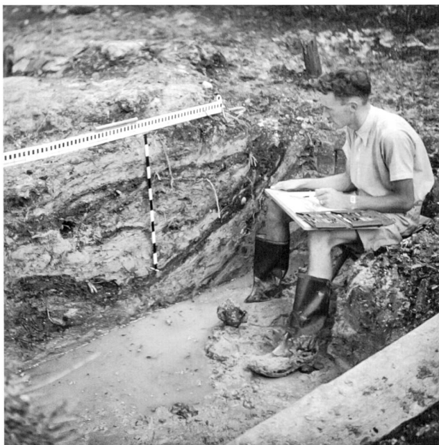
In den 1950er Jahren in Burgäschisee-Süd SO. Aufnahme von 1952, Bernisches Historisches Museum, Bern