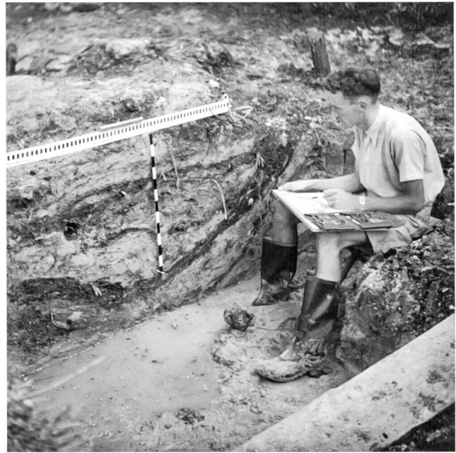
In den 1950er Jahren in Burgäschisee-Süd SO. Aufnahme von 1952