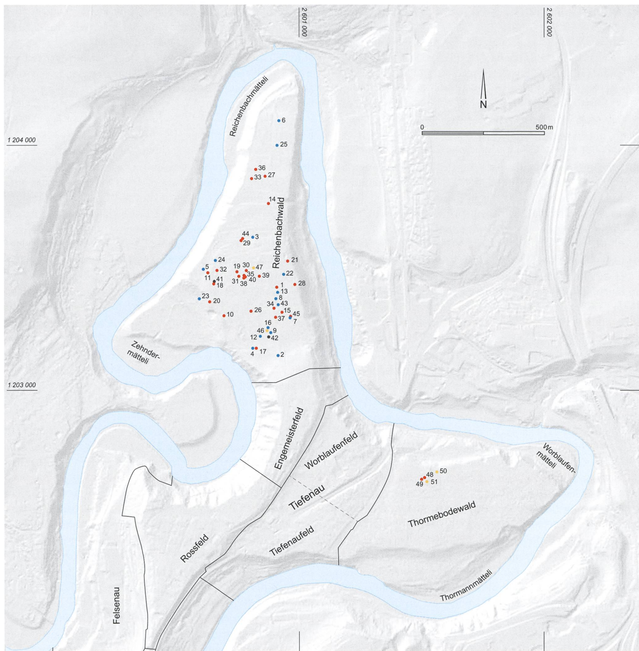
Abb. 1. Bern-Engelhalbinsel BE, topographischer Plan mit den Flurnamen sowie der Kartierung der latènezeitlichen Fundmünzen aus den Prospektionen 2016–2018. Blau = ältere Münztypen (LT D1 bzw. LT D1/D2), rot = jüngere Münztypen (LT D2), schwarz = Münztyp unbestimmt, orange = Schrötlinge und Gussreste. Die Zahlen bezeichnen die Katalognummern. Archäologischer Dienst des Kantons Bern.

Insgesamt wurden während der Prospektionen 2016–2018 im Reichenbachwald neben 113 römischen 45 keltische Münzen sowie ein Silber- und ein Potingussrest (Kat. 1–47) aufgelesen (Abb. 1) 18 . Aus dem Thormeobodewald indessen stammen nur sieben römische und zwei keltische Münzen sowie zwei Silberplättchen (Kat. 48–51), die möglicherweise als spätlatènezeitliche Schrötlinge für Obole und/oder Quinare anzusprechen sind 19 . Im Folgenden ist zu untersuchen, inwieweit die jüngst gemachten Funde neue Erkenntnisse zur Siedlungsentwicklung auf der Engehalbinsel liefern.