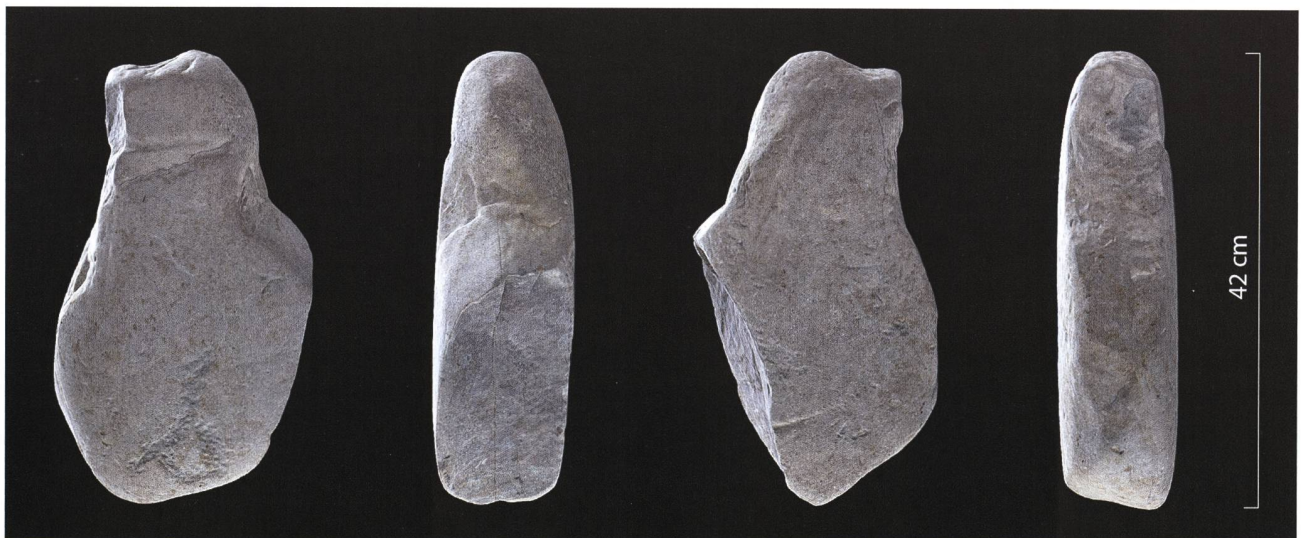
Abb. 3. Cham-Oberwil ZG, «Äbnetwald». Unter Ausnutzung der natürlichen Form des Sandsteinblocks und mittels künstlicher Bearbeitung wurde in der Silhouette eine stilisierte anthropomorphe Form erzielt. Die Schauseite zeigt intentionell vorgenommene Bearbeitungen: Eine horizontal verlaufende, eingeschliffene Halsrinne trennt Kopf und Rumpf, im unteren Bereich befindet sich eine in den Stein gepickte Figur. Die Spuren auf der Rückseite dürften natürlichen Ursprungs sein (u.a. Gletscherschliff). Ansichten abgeleitet aus einem photogrammetrischen 3D-Modell der Stele, vgl. https://sketchfab.com/ADA-ZG/collections/cham-oberwil-abnetwald-steinstele . Grafik ADA, Jochen Reinhard/Salvatore Pungitore.