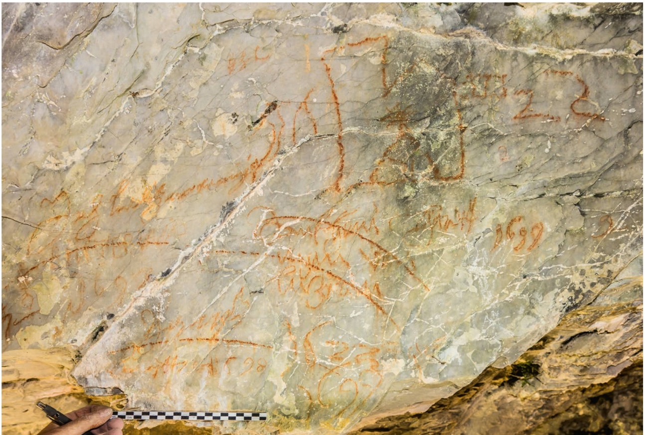
Abb. 5. Engelberg OW, Inschriftenbalm: Rötelf-Inschriftenzone 2.

Die Radiokarbonalter der Holzkohlen aus der Sondierung 1 in der Bräcbalm datieren um 2200 BP bzw. 388–198 v. Chr. (cal. 2 sigma). Dies entspricht zeitlich der Jüngeren Eisen-