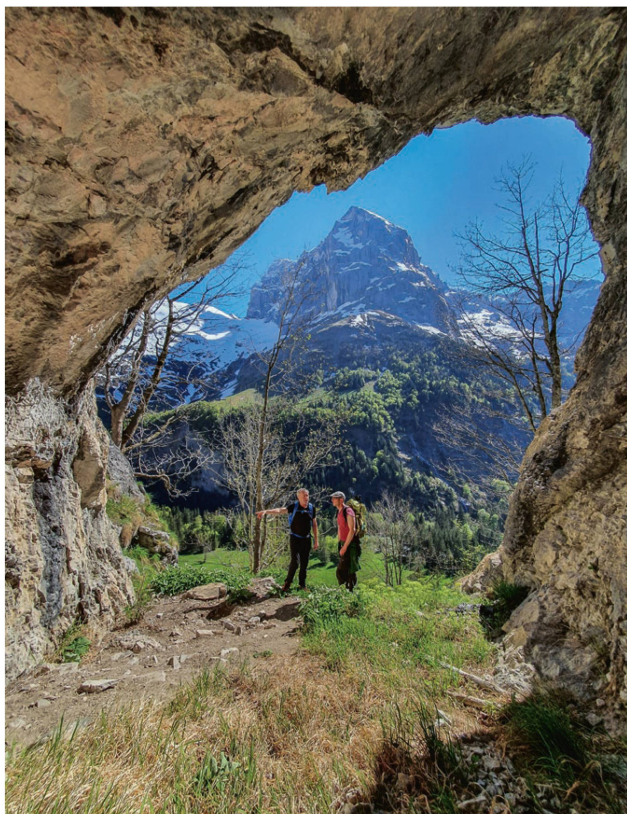
Abb. 2. Engelberg OW Brächbalm. Blick aus der Balm nach Süden auf den Titlis-Nordpfeiler und die Titlis-Ostwand.

Im Jahr 2021 wurde mit Bewilligung des FDAO der Boden der Balm durch Martin Berweger und Bea Koens mit dem Metalldetektor abgesucht. Dabei kamen einige neuzeitli-