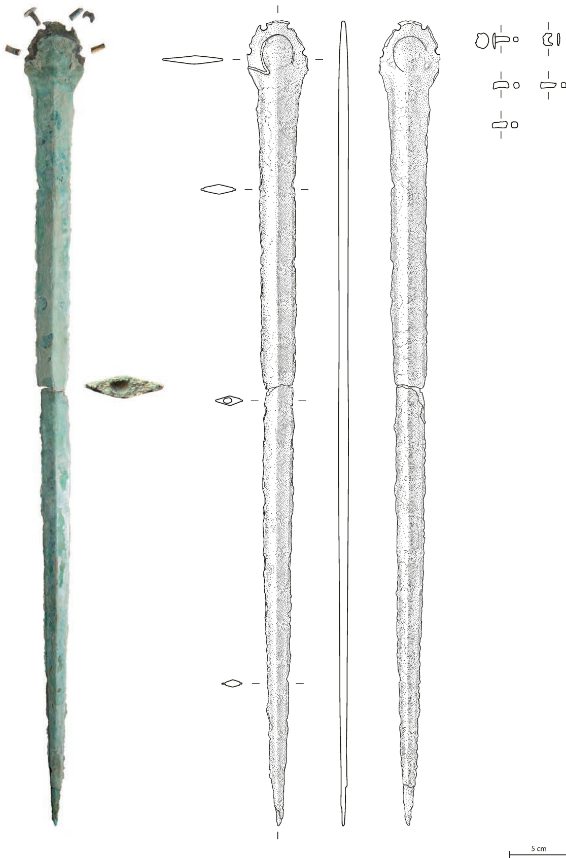
Abb. 3. Eschenz-Hörnliwald TG. Das im Bereich eines Gusslunkers in zwei Teile zerbrochene Bronzeschwert mit Ring- und Pflocknieten. Der Ansatz des organischen Griffs zeichnet sich über die unterschiedliche Patinierung ab. Detail Gusslunker nicht massstäblich. Foto AATG, J. Rüthi und U. Leuzinger, Zeichnung J. Näf.