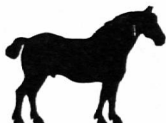
d a s P f e r d