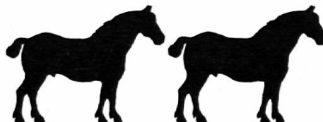
d i e P f e r d e