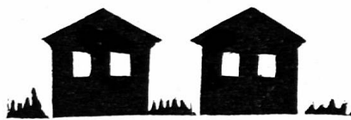
d i e S t ä l l e

E i n z a h l bedeutet: nur ein Ding, M e h r z a h l : bedeutet: mehr als ein Ding.