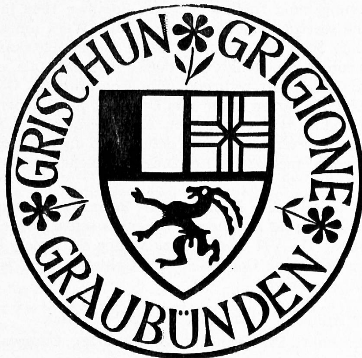
Buchzeichen der Kunstdenkmäler