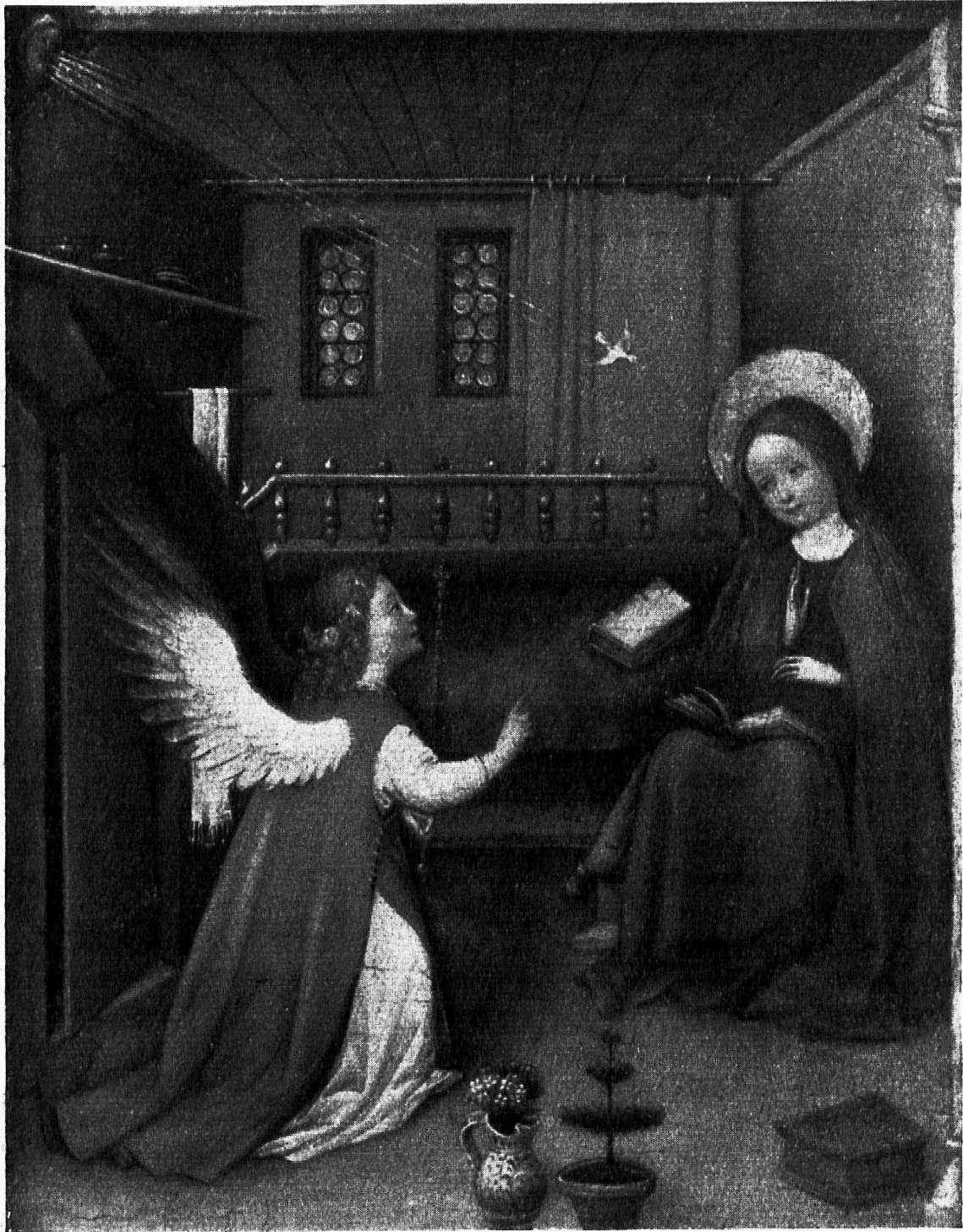
Oberrheinischer Meister um 1420 Die Verkündigung an Maria (Sammlung Dr. Oskar Reinhart, Winterthur)

Der Maler dieses kleinen Holztafelbildes stammt aus der Gegend zwischen Basel und Straßburg. Mit fast kindischer Naivität schildert er die Verkündigung. Wenige leuchtende Farben, blau, rot und grün sind in die braunen Töne des Raumes eingebettet. Der Engel sucht Maria in ihrem Zimmer auf. Das Zimmer ist mit derselben Naivität gestaltet wie die Figuren. Es wirkt eher wie eine Raumnische, weil der Maler die perspektivischen Gesetze noch nicht kennt. Ganz unbekümmert um die perspektivische Erscheinung stellt er das Kästchen im Vordergrund oder das Buch auf der Bank dar