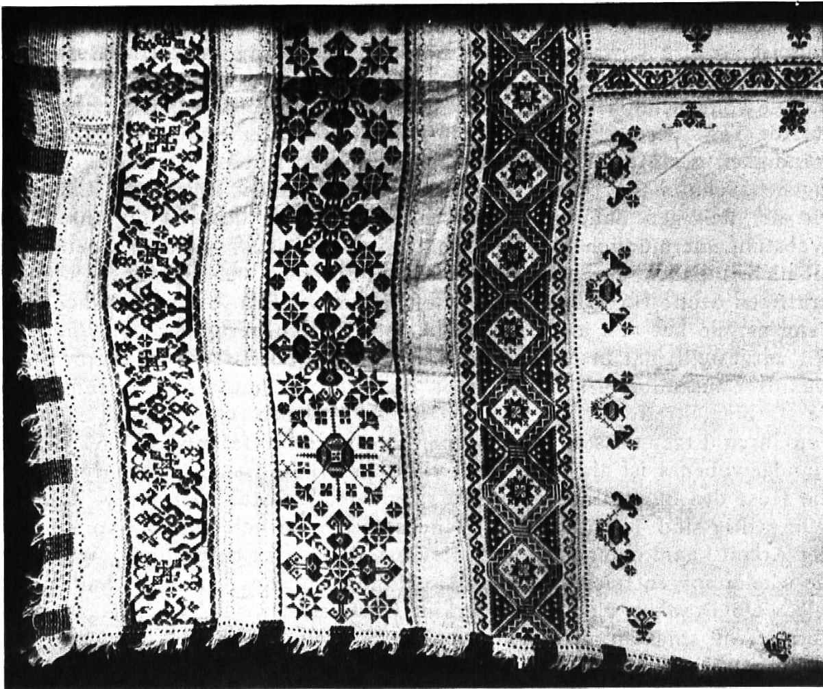
Paradeleintuch aus Manas, Unterengadin

Von den Gruppen, die Richard Weiß bezüglich der Volkstracht hervorhebt, sei nur noch auf die Berufstrachten eingegangen. Es war vor allem die Frauenschule Chur im Verein mit den beiden Trachtenstuben, die bestrebt war, in Graubünden den Bäuerinnen ein Berufskleid zu vermitteln. Aus selbstgewobenen Stoffen soll es bestehen, praktisch in der Form, gefällig und vor allem auch den klimatischen Verhältnissen unserer Bergenden angepaßt sein. Da und dort schafft man sich solche Kleider an,