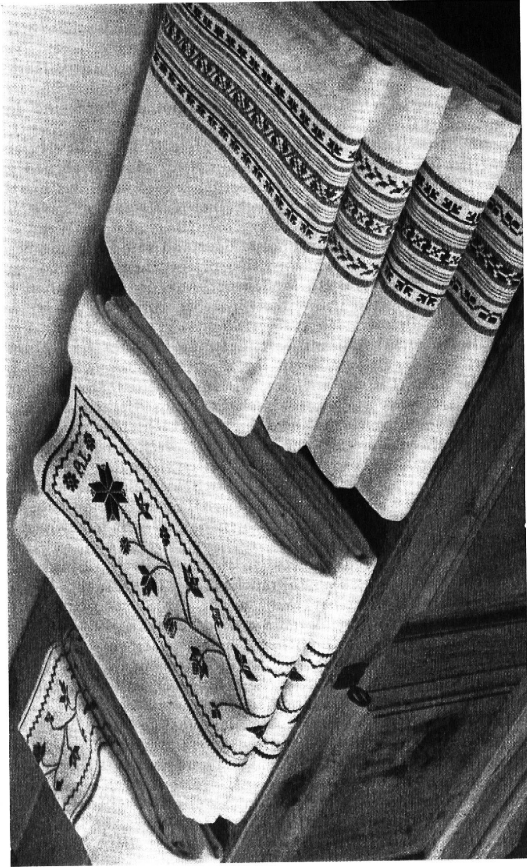
Leintücher mit Bündner Kreuzsticheinsätzen