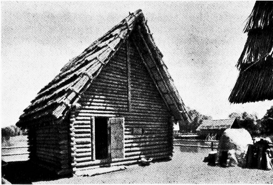
Das Haus des Töpfers

Das Haus des Dorfoberhauptes fällt schon äußerlich durch die eigenartige Form der Dachgestaltung auf, die dem Rauch freien Abzug gestattet. Im Arbeitsraum finden wir den Webstuhl mit den Geräten der Spinnerei und Weberei. Hier ist schon ein bedeutender Fortschritt gegenüber dem Webstuhl aus der Steinzeit feststellbar. Den Mittelpunkt des Wohnraumes bildet die große, aus Steinen errichtete Herdstelle, über der an drehbarem Galgen der schön gearbeitete bronzene Kochkessel aufgehängt ist. Neben dem Haus des Dorfoberhauptes lagert der über 5 m lange, aus einem Eichenstamme herausgehauene Einbaum . Er bildet ein wendiges, leicht lenkbares Fahrzeug, das, mit den auffallend kurzen, einseitigen Paddelrudern getrieben, dem Fischfang diente und den Verkehr von Pfahldorf zu Pfahldorf vermittelte.