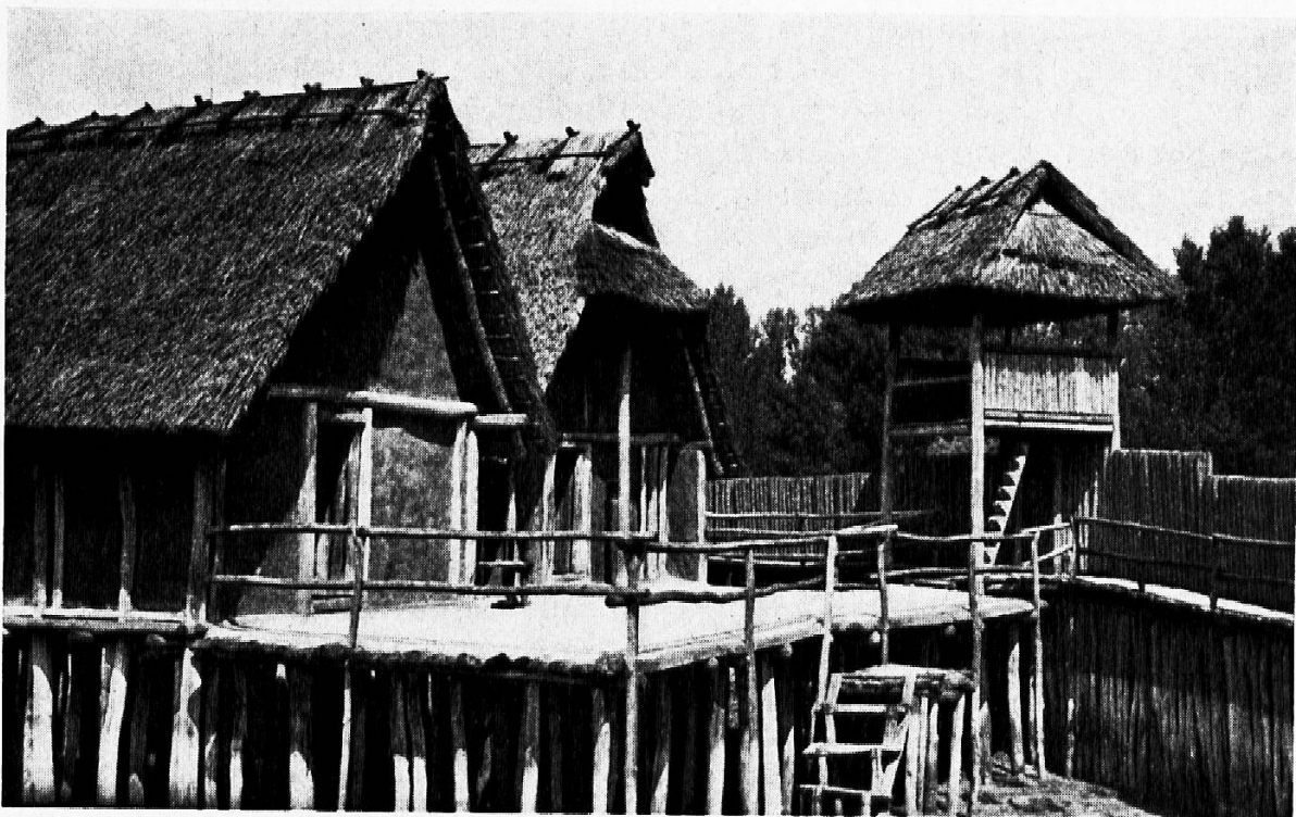
Wohnhäuser, Wehrturm und Wehrpalisade im Pfahlbaudorf der Steinzeit, etwa 2200 v. Chr.