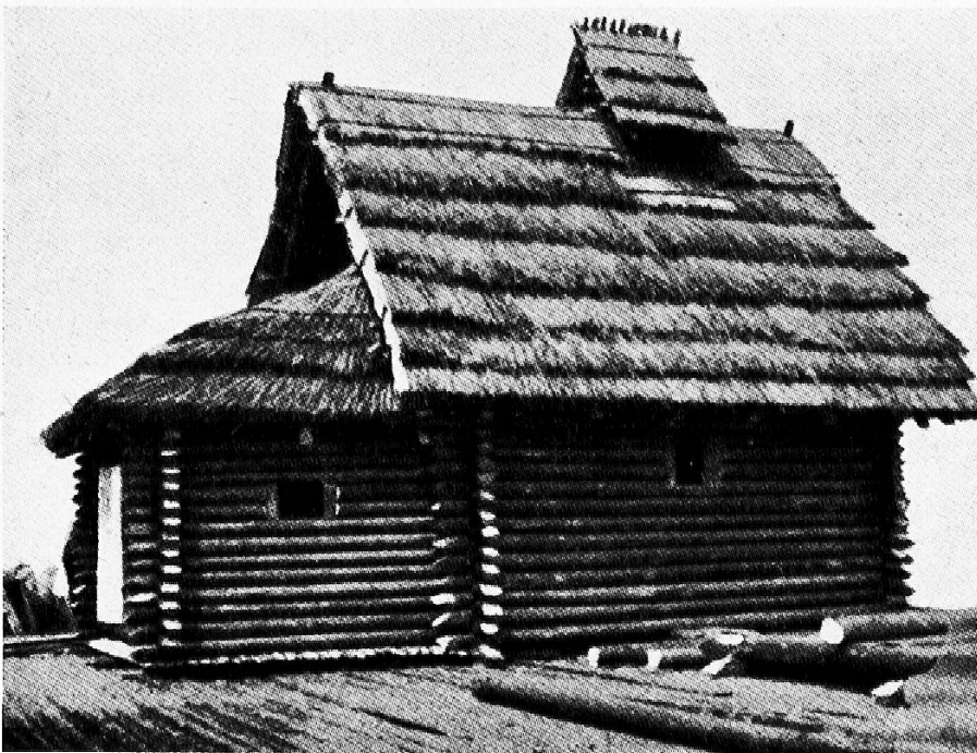
Das Haus des Dorfoberhauptes

Die fünf bronzezeitlichen Pfahlhäuser, die von einer gemeinsamen, frei rekonstruierten Plattform getragen werden, sind in ihrem Grundriß und Aufbau dem älteren Dorfe der Wasserburg Buchau im Federseemoor entnommen, das um 1100 v. Chr. errichtet wurde. Sie bilden dort eine Häusergruppe an dem geräumigen Dorfplatz und umfassen das Haus des Dorfoberhauptes, eine Vorratshütte und drei Wohnbauten. Letztere wurden als Haus des Töpfers, des Bronzegießers und des Hirten ausgestattet. In der Technik haben wir nicht mehr die großen Rechteckhäuser mit Flecht- und Stabwänden vor uns, wie sie in der Steinzeit errichtet wurden, sondern neben Flechtwandhäusern, als Neuschöpfung der Bronzezeit, die konstruktiv sehr schönen Blockbauten .