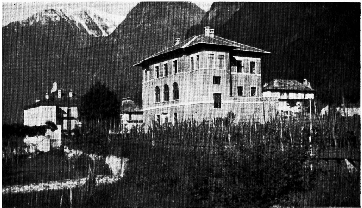
Schulgebäude in Roveredo

Bregaglia und Valle Poschiavina, vom übrigen Bünden durch hohe Gebirgsmauern getrennt, unter sich von Bergen und ausländischem Gebiet geschieden, vereinsamt, mit Ausnahme des Misox, das dem Tessin die Hand reichen darf, auf sich selbst gestellt, strömen und fallen diese Täler nach Süden, während sie die Geschichte an den Norden gekettet hat. Ja, so ist's, nicht die Natur, die Geschichte wollte es so!»