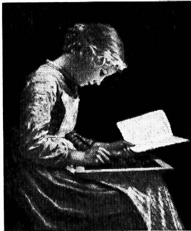
Anker: Die schreibende Schülerin

Die Zeiten ändern — eines ist sich aber gleich geblieben, Auf Schiefertafeln wird auch heute noch geschrieben!