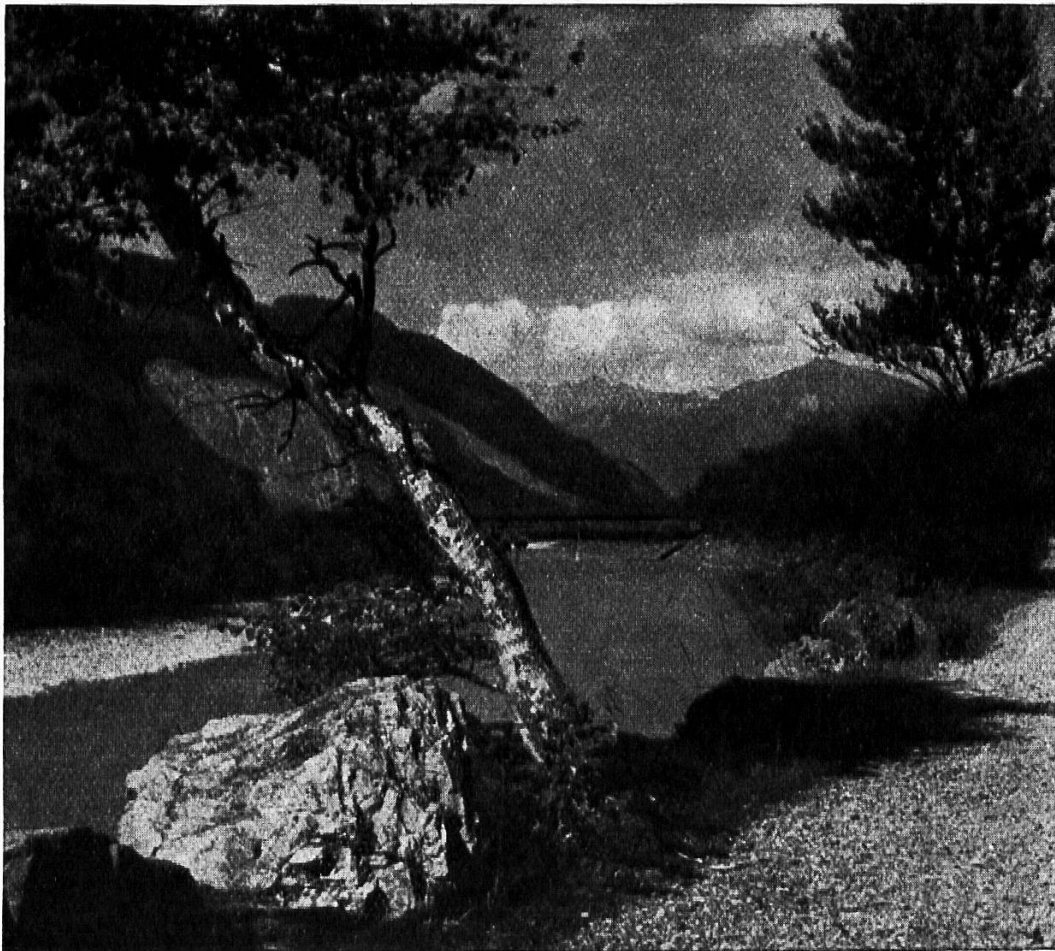
Wanderweg am Rhein bei Chur