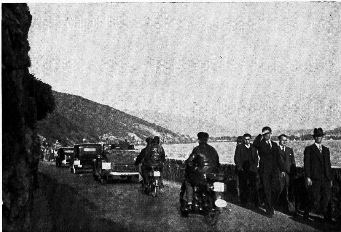
„Das Wandern ist des Müllers Lust“

Aber jede Entwicklung ruft Begleiterscheinungen wach, in der Regel Reaktionen, also Gegenströmungen. Aus der Erkenntnis heraus, daß die mechanisierte und motorisierte Welt uns etwas genommen hat, was der Mensch notwendig braucht, daß wir nicht von der Geschwindigkeit allein leben können, kamen um die Jahrhundertwende die Wandervögel auf; ihnen folgten die Jugendherbergen, und seit zwei Jahrzehnten ist in unserem Lande die Wanderwegbewegung tätig. Sie wollte die Menschen aus der Hetze von