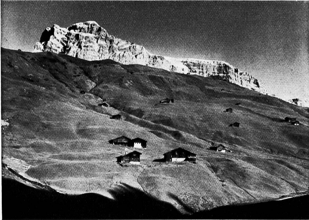
St. Antönien (Prätigau)

terrichtsstunde im Schulraum. Der Lehrer darf der Kritik, die hier gelegentlich am falschen Ort einsetzt, mit gutem Gewissen erwidern, daß er sich auf diese Weise durchaus nicht etwa Erleichterungen verschafft, wie man ihm nicht ungerne vorwirft. Auch der Gewinn des Schülers soll nicht etwa kleiner sein. Dabei denke ich nicht nur an den Ertrag an erzieherischen und kenntnismäßigen Werten; es wäre auch ein unbestreitbarer Erfolg, wenn auf diese Weise die Freude und der Genuß an einer Fußwanderung geweckt und gefördert würden. Und das scheint mir ein Weg zu sein, durch den das Kind sehen lernt, wieviel an Schönerm einem auch auf einer kleinen Wanderung, sofern die Augen dafür geöffnet sind, entgegentritt und wieviel des Interessanten man erleben und erwandern kann, wenn man nicht achtlos und blasiert an allem vorbeirent.