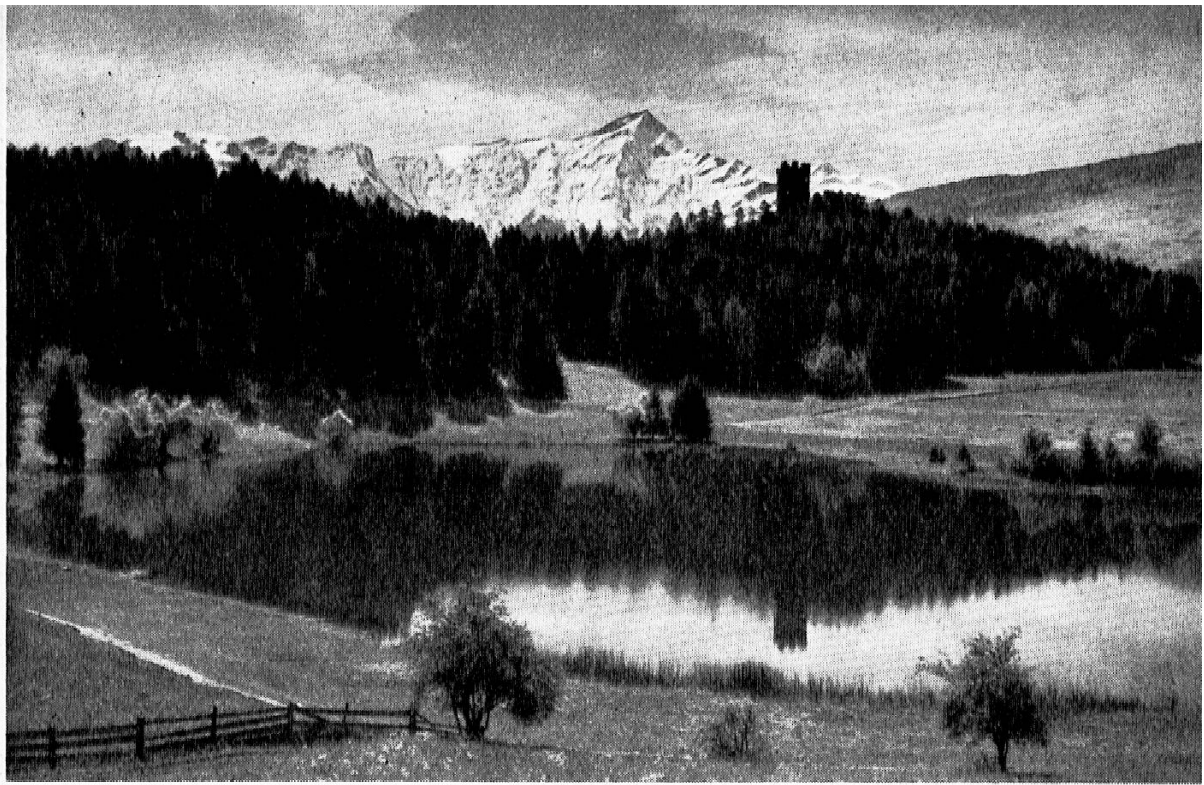
Canovasee mit Ruine Canova, im Hintergrund Piz Beverin

ihr Allerweltsgrün. Sie haben sich ins Falbe und Bräunliche verfärbt. Und die Wälder! Das warme Rotbraun der Buchen im Prätigau und in der Herrschaft stimmt ganz anders zum föhnklaren Himmel als die sömmerliche Belaubung, und das Lärchengold, das ganze Bergflanken überzieht oder vereinzelt wie Flammen aus dem schwärzlichen Tannengrün leuchtet, verwandelt die brave Sommerlandschaft in eine festliche Szenerie. Aber auch der Winter ist Wanderzeit, nicht für jedermann allerdings. Die Leichtsinnigen, die glauben, in jeden Schneeang dürfte man seine Ski-Signatur eintragen, halten sich besser an die Herdengefilde der Pisten oder unterziehen sich den Ratschlägen des Lawinenbulletins. Die Besonnenen aber werden gerade das winterliche Unbelebte der Natur als besonderen Reiz empfinden. Sie suchen ja das Unbetretene, das völlig Andersartige.