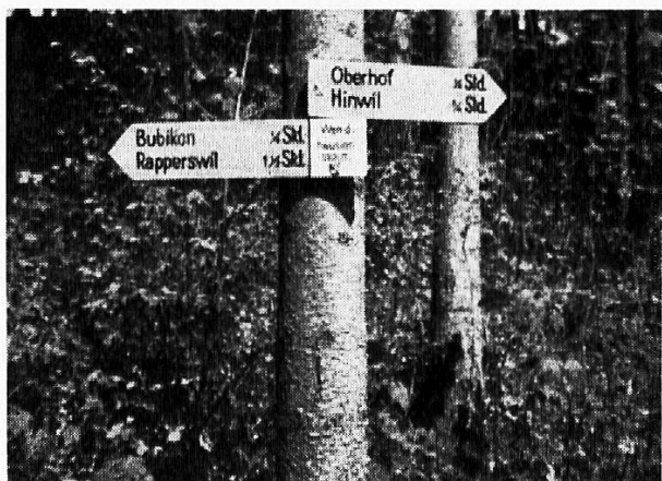
Ausnutzung natürlicher Möglichkeiten für die Anbringung von Wegweisern

Die kantonalen Sektionen sorgen in ihren Gebieten für die Durchführung der Markierungen nach den Grundsätzen der Richtlinien. (Diese haben sich in der zwanzigjährigen Arbeitsperiode voll bewährt, und wesentliche Abweichungen mußten als nicht ratsam bezeichnet werden.)