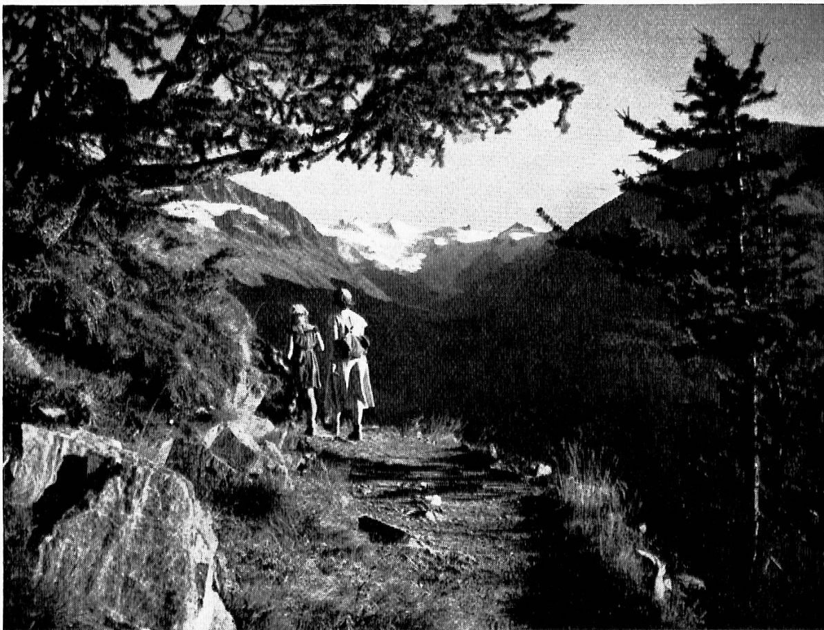
Auf dem Höhenweg zwischen Muottas Muragl und Alp Languard

Aber wir wollten ja vom Menschen sprechen, von seiner Wanderschaft, und nicht von der Wanderschaft seines Lebens, die mit der Geburt beginnt