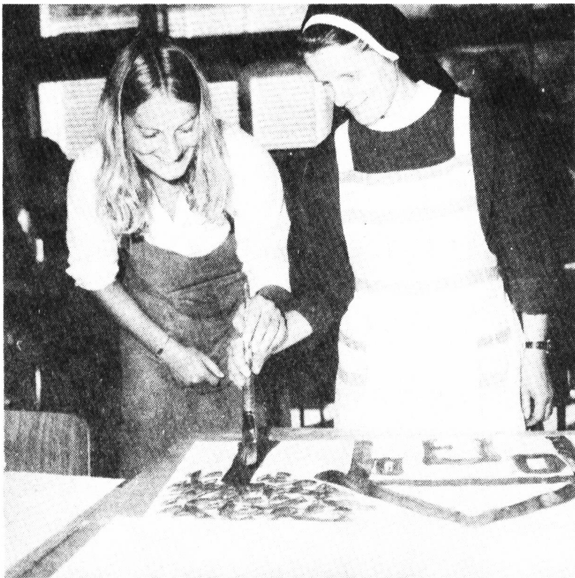
Aus dem Kurs «Rhythmisches Malen» mit Josef Ammann