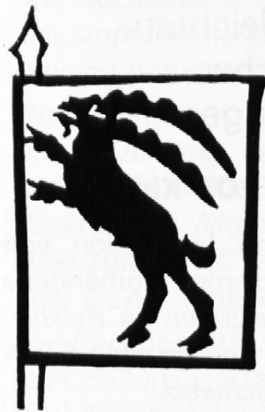
Fahne des Bistums Chur um 1340

Wir möchten die Lehrerschaft daran erinnern, dass das Bündner Kunstmuseum von geführten Schulklassen auch ausserhalb der normalen Öffnungszeiten, nämlich von 08.00–10.00 Uhr sowie montags von 08.00–12.00 und 14.00–17.00 Uhr, besucht werden kann. Erforderlich ist lediglich eine Anmeldung durch den Lehrer zwei Tage im voraus.