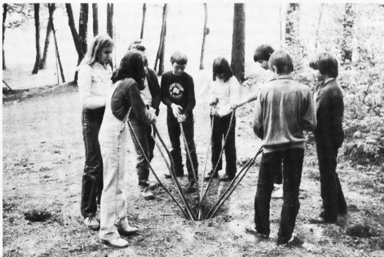
Sautreiben (nachgestellt von einer Churer Schulklasse)

Diese Statistik beweist einmal mehr, dass die Bündner Lehrerinnen und Lehrer sehr fortbildungsfreudig sind!