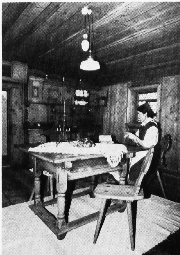
Stube im Museum Regional in Savognin

Mit zunehmendem Alter stösst unser Wunsch, ausser dem Zug-, Car-, Schiff- und Kioskerlebnis noch etwas Substanzielleres einzubringen, bei vielen Schülern auf mehr oder weniger spürbaren Widerstand. Das kann soweit führen, dass intelligente Jugendliche zwar eine Grossstadt im Ausland besuchen möchten, den Verantwortlichen aber bitten, allfällige kulturelle Aktivitäten nicht obligatorisch zu erklären.