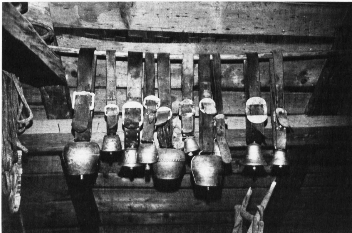
Schellen und Glocken vom Ortsmuseum Laax

Weitere Informationen erhalten Sie sicher beim Restaurator eines Museums in ihrer Umgebung oder bei einem freischaffenden Restaurator.