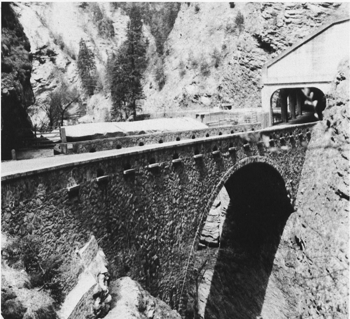
Brücke der Kantonsstrasse mit Galerie in der Viamala-Schlucht. Neben der Strassenbrücke die alte Wildener-Brücke aus dem Jahre 1738 (zugedeckt, in Renovation)

Nun wäre in einem Kulturführer nachzulesen, auf was hier alles geachtet werden soll (muss): Die Galerie mit der Wildener-Brücke aus dem Jahre 1738, die Überreste mittelalterlicher Wege auf der andern Schluchtseite, Gletschermühlen auf dem Grund der Schlucht.