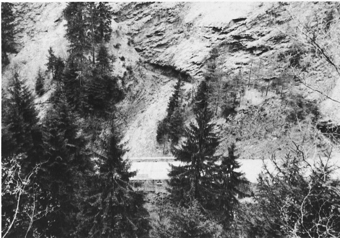
Überreste eines mittelalterlichen Weges auf der gegenüberliegenden Schluchtseite

(Galerie und Wildener-Brücke werden zurzeit renoviert; die Inschrift wurde deswegen vorübergehend entfernt.)