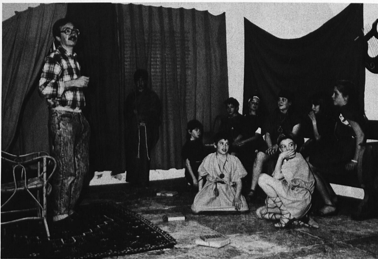
Römischer Schulalltag. Letzte Regieanweisungen. Szenenfoto aus dem Videofilm «Das Erbe der Römer».

Der Video-Einsteiger wird sicher mit dem Aufzeichnen und Abspielen geeigneter Schulfernsehsendungen beginnen und bald merken, dass ein genau dosierter und zielgerichteter Einsatz dieser Filme eine wertvolle Bereicherung