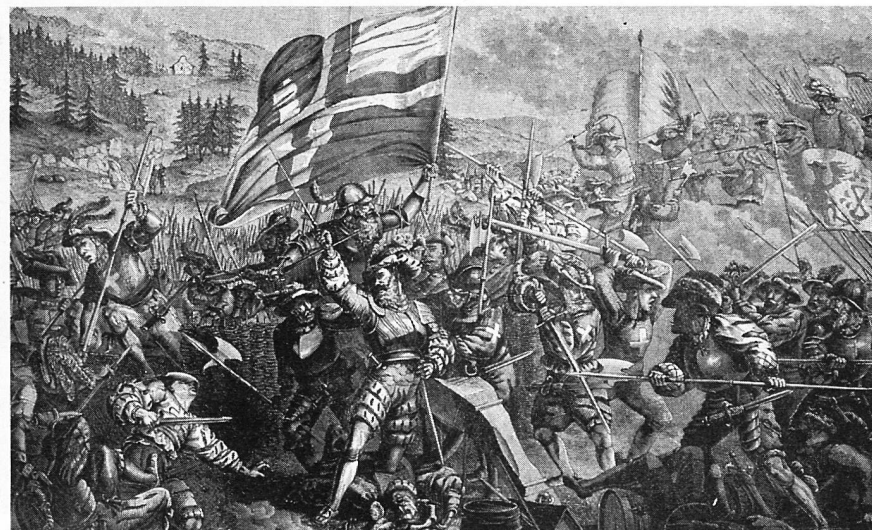
So stellte man sich im 19. Jahrhundert die Calvenschlacht vor.