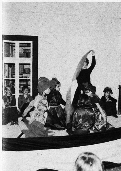
Früh übt sich...