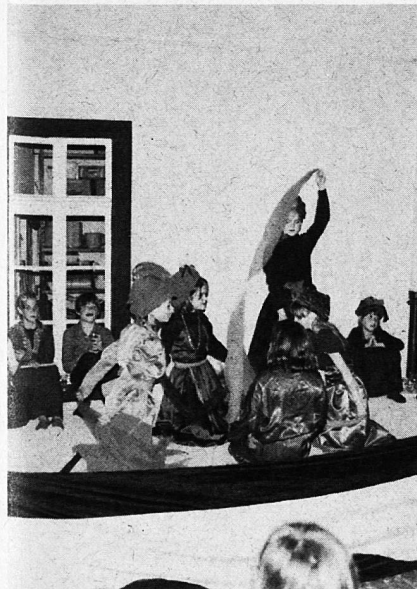
Früh übt sich...